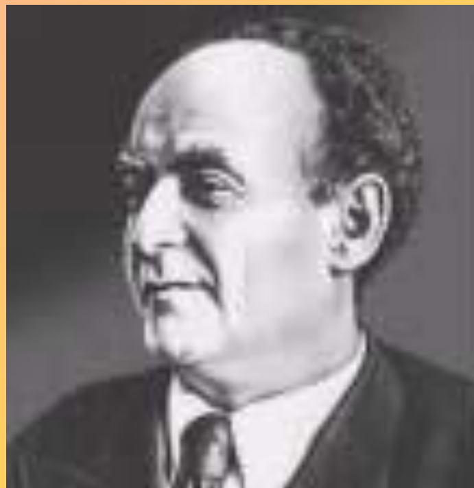
Рувим Исаевич Фраерман