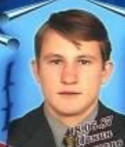
А.А. Васильев Математика