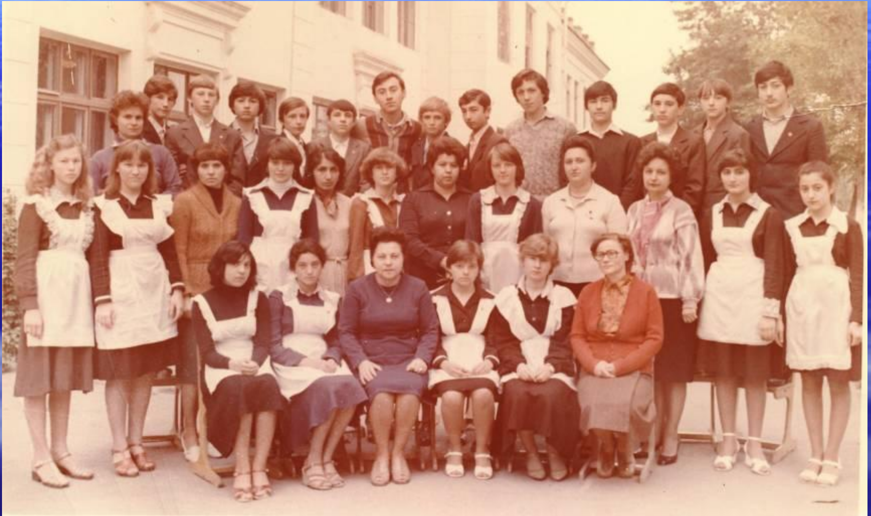
Первый выпуск в г. Нальчике