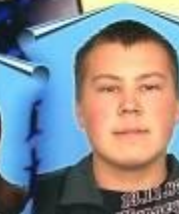
А.А. Васильев Математика