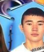
А.А. Васильев Математика