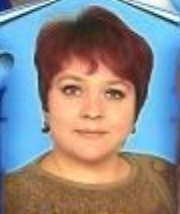
Н.Б. Курикова Информатика