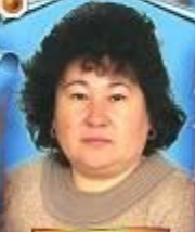
З.Б. Прудникова Химия