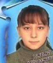
А.А. Васильев Математика