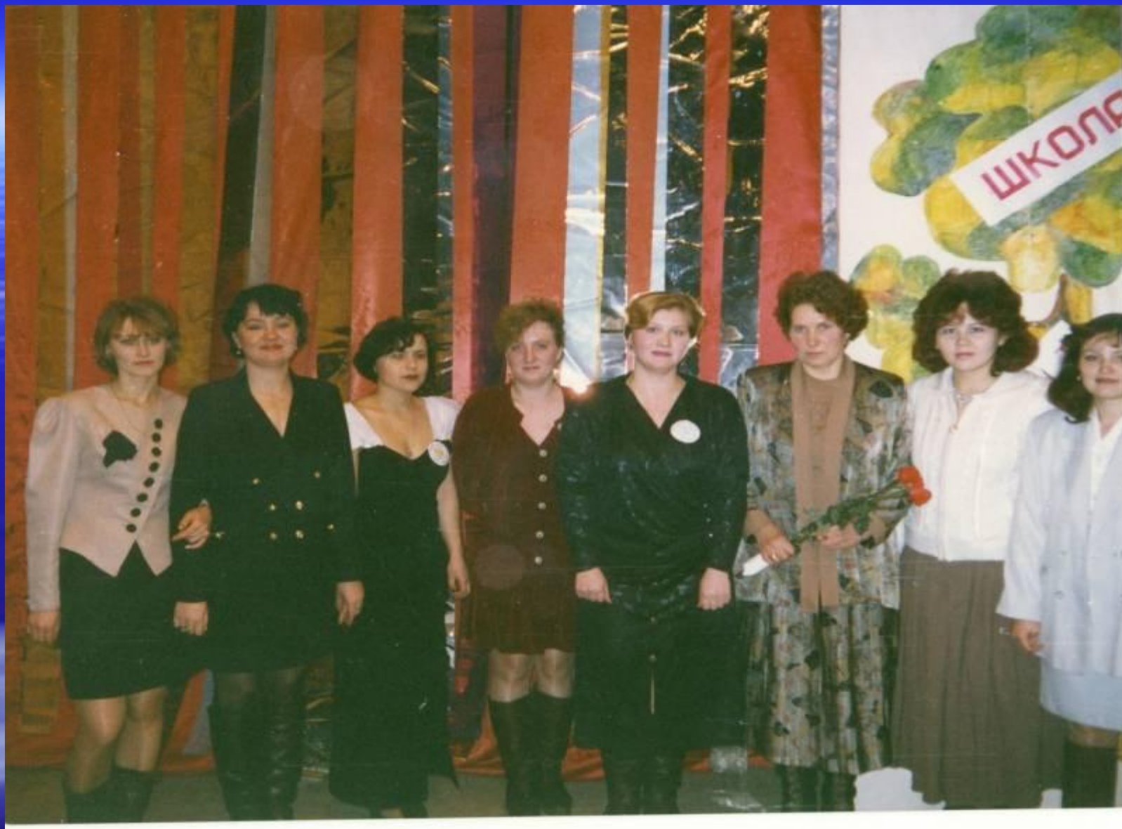
На 70 – летнем юбилее школы с бывшими учениками