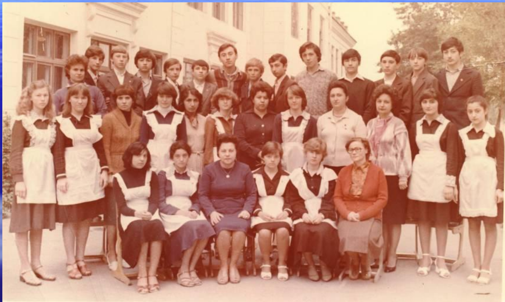
Первый выпуск в г. Нальчике