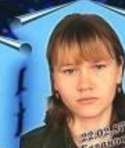
А.А. Васильев Математика