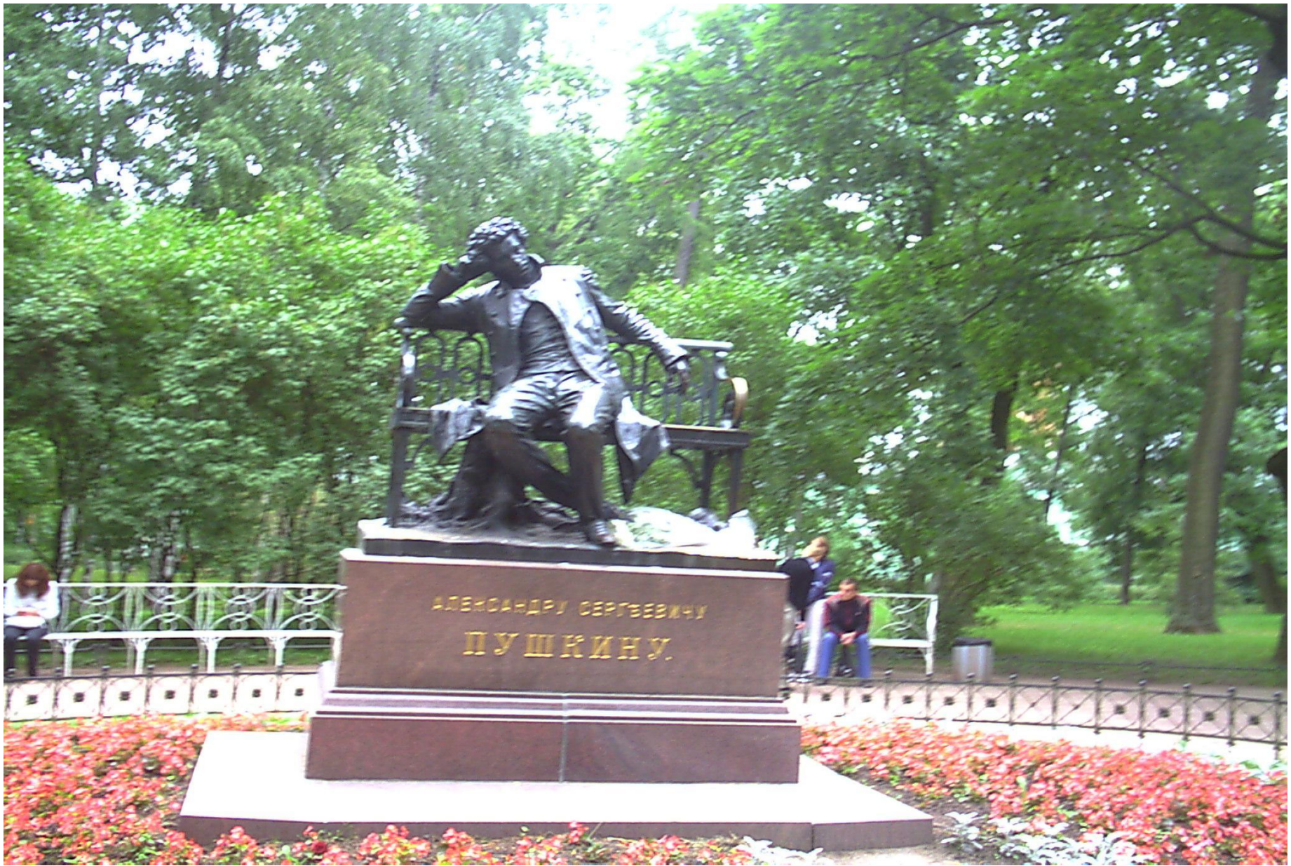
Памятник А.С. Пушкину во дворе Лицея