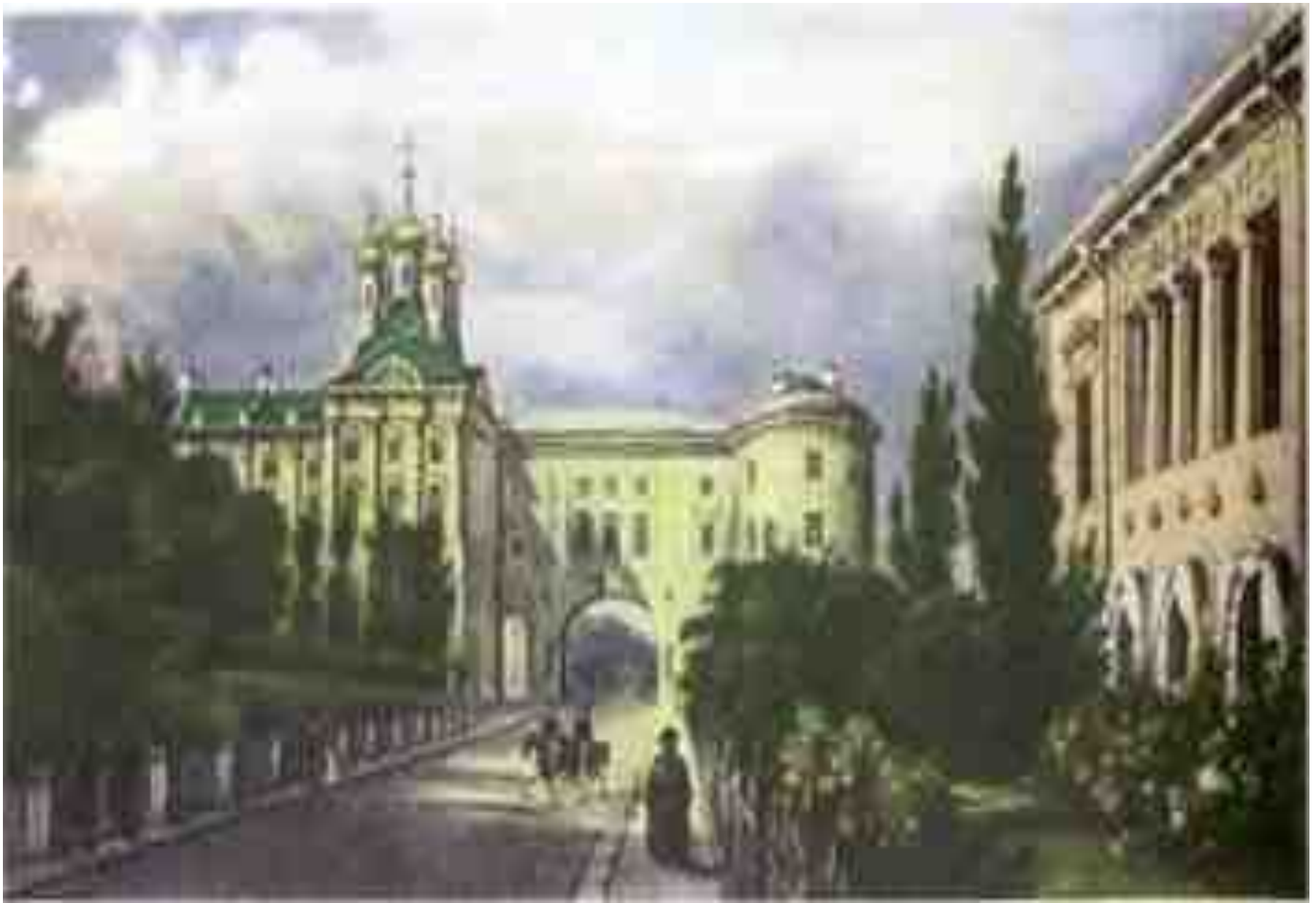
Царское село. Екатерининский дворец