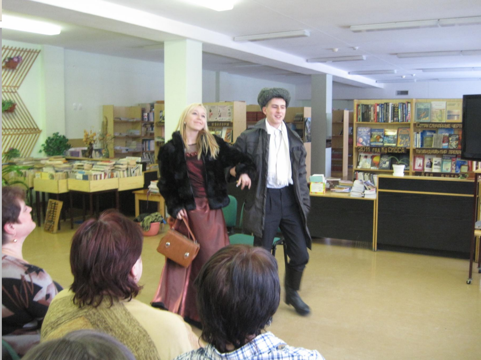
Инсценирование рассказа М.Зощенко «Аристократка»