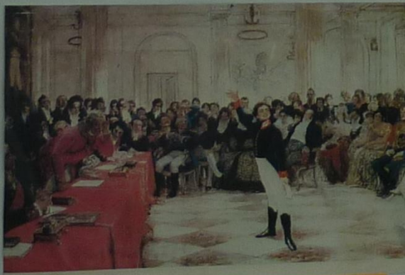
И. Репин. ПУШКИН НА ЛИЦЕЙСКОМ АКТЕ. 1911

На четвертом этаже находились комнаты лицейстов - небольшие узенькие «келья», как называл их Пушкин. Александр жил в комнате №14, а его ближайший друг, Иван Пушкин - в комнате №13. Пушкин был чрезвычайно привязан к своим школьным товарищам, и эту выскую дружбу, верность лицейскому братству он пронес через всю жизнь.