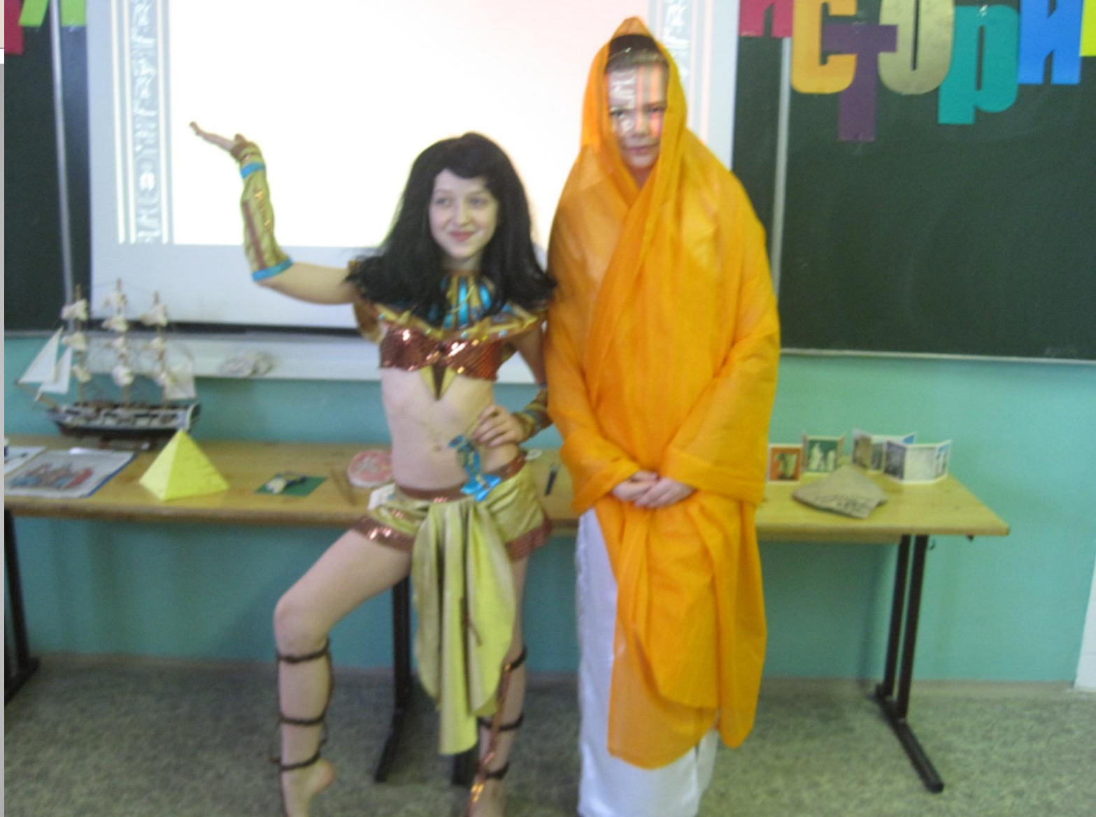
Активные участники 5 «Б»