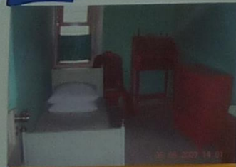
Комната №13, где жил Пушкин.

Прости! Где б ни был я: в огне ли смертной битвы, При мирных ли брегах родимого ручья, Святому братству верен я!