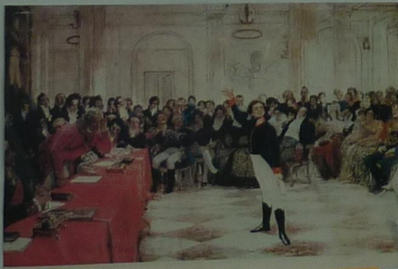
И. Репин. ПУШКИН НА ЛИЦЕЙСКОМ АКТЕ. 1911

На четвертом этаже находились комнаты лицейстов - небольшие узенькие «келья», как называл их Пушкин. Александр жил в комнате №14, а его ближайший друг, Иван Пушкин - в комнате №13. Пушкин был чрезвычайно привязан к своим школьным товарищам, и эту выскую дружбу, верность лицейскому братству он пронес через всю жизнь.