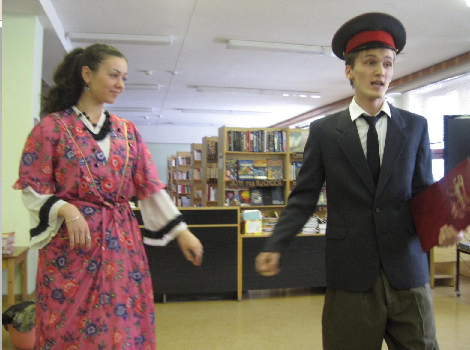
Инсценировка по рассказу «Любовь» М.Зощенко.