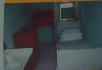
Комната №14, где жил Пушкин.