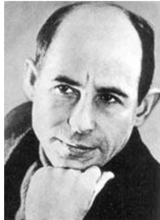
Рубцов Николай Михайлович (3.01.1936, пос. Емецк Архангельской обл. – 19.01.1971, Вологда)