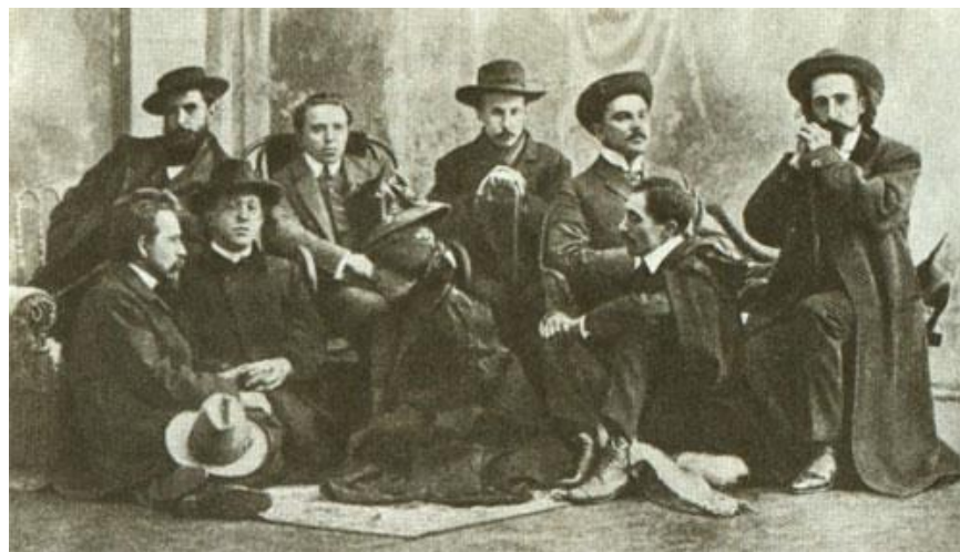
Блок в группе литераторов

После окончания гимназии, в течение последних лет девятнадцатого столетия, Блок вновь проживает русскую поэзию – от Жуковского до Фета. Ему дороги Пушкин, Лермонтов, Тютчев, Полонский. Он проникается романтическими мотивами, образами русской поэзии. Эти годы он ощущает как время «Перед рассветом»; поэта волнуют смутные надежды, поиски Идеала, “неведомого Бога”. В “предрассветных сумерках” Блок пытается ощутить духовные основы жизни, предчувствует преображение мира. Но своё творчество Блок хранит в глубокой тайне, как нечто сокровенное.