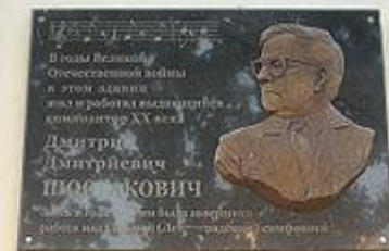
Мемориальная доска в честь Дмитрия Шостаковича в Самаре