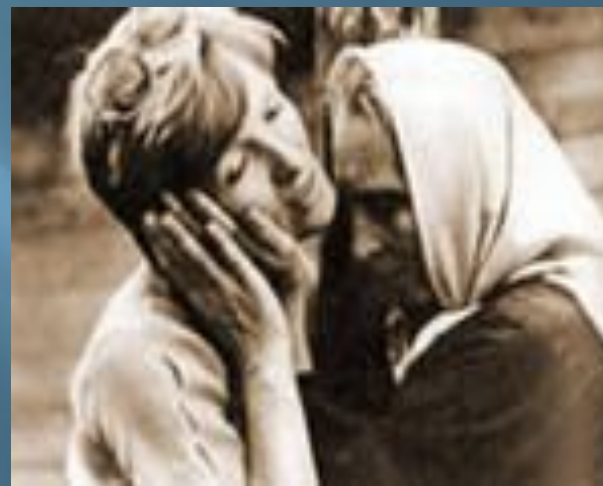
На съемках кинофильма с актрисой Стефанией Станютой