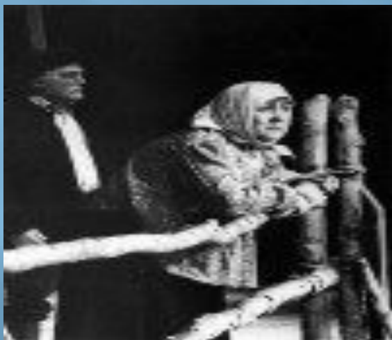
спектакль «Прощание с Матерой» впервые был поставлен во МХАТе

Во второй половине 70-х годов по его произведениям ставятся спектакли и фильмы.