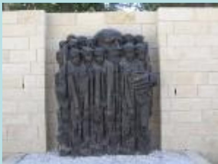
Памятник в Иерусалиме Я. Корчаку