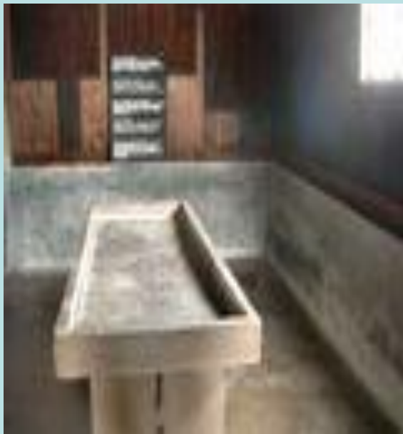
Стол для препарирования