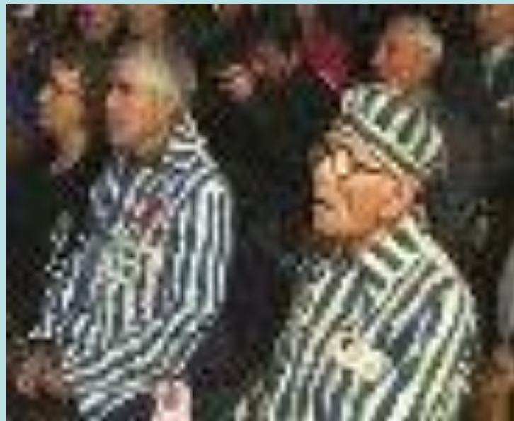
Крест узников концлагерей