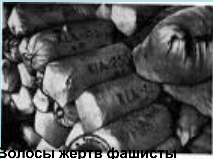
Волосы жертв фашисты использовали для нужд промышленности