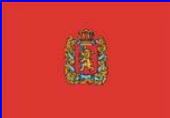
Флаг Красноярского края