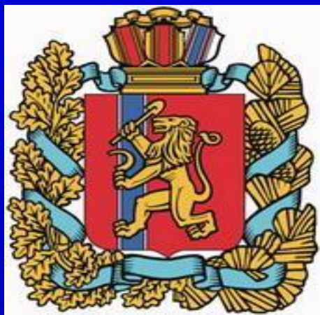
Герб Красноярского края