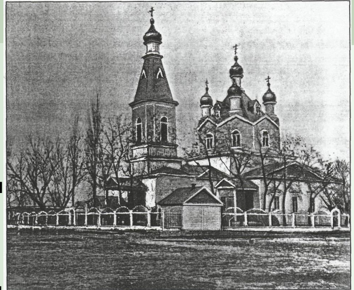
Троицкая церковь в селе Иванчуг.

В 1930-е годы церковь закрыли, а в 1939 году из Астрахани приехали люди с приказом о сношении церкви. В этот же год ее и стали ломать. Так как церковь была сделана из сруба, ее растаскивали по бревнышку. Купола и кресты снимали и переплавляли. Иконы рубили и отдавали морякам на дрова. Правда, часть икон иванчугцы сохранили у себя. Спасена была и чудотворная Федоровская икона Богородицы, помолиться к которой приезжали люди со всей России и из-за рубежа.