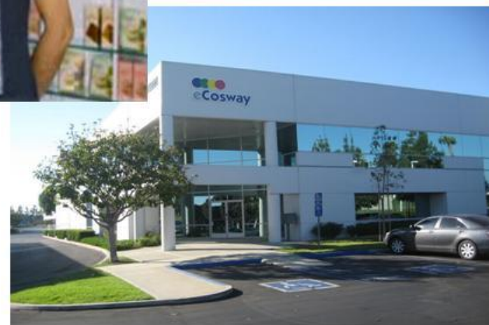
Офис eCosway в США

США - более $ 350,000 - оборот в первый месяц работы магазина!