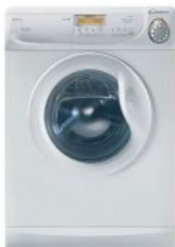
б) стиральная машина