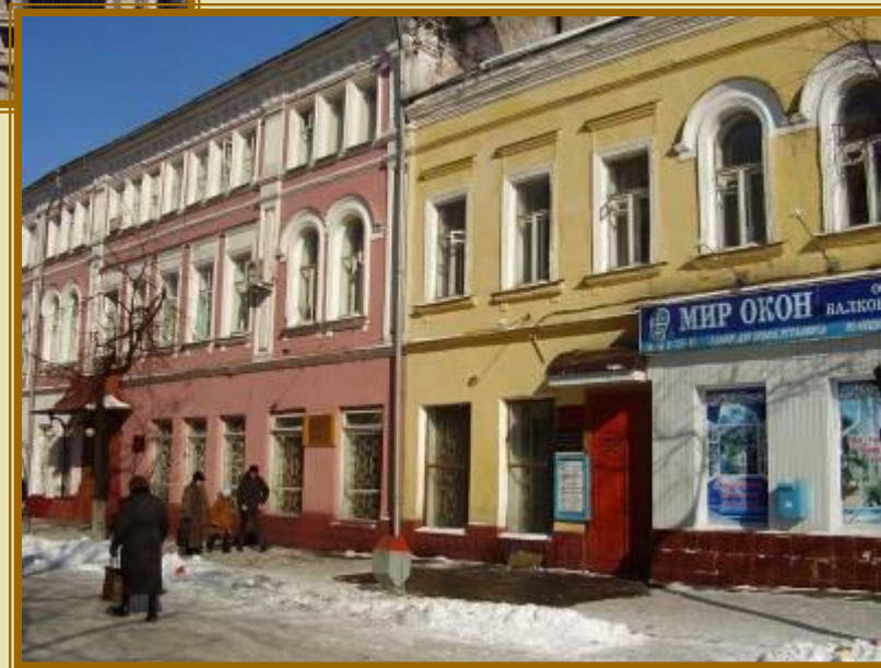
Детская музыкальная школа № 1