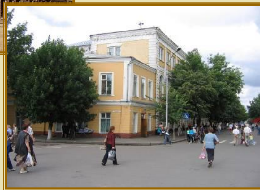
МОУ СОШ № 18 им. Героя Советского Союза Э. Д. Потапова