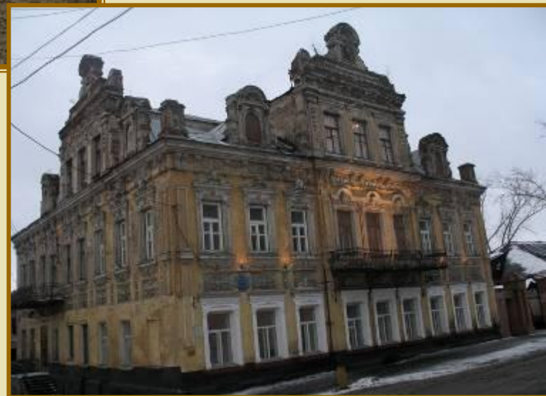
Улица Гагарина, МОУ СОШ № 16