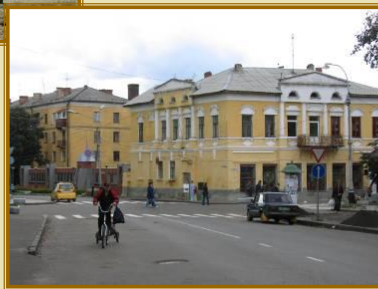
Улица Гоголевская. Хлебный магазин