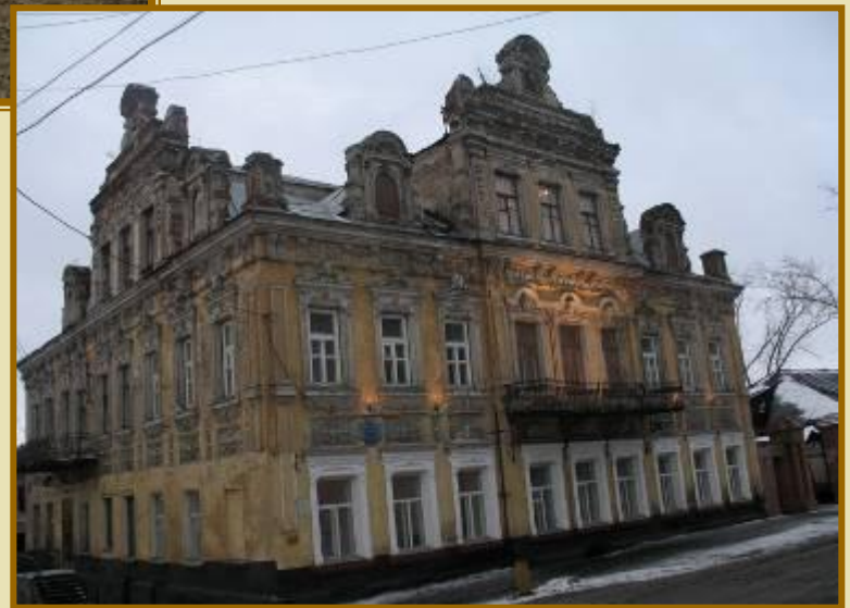
Улица Гагарина, МОУ СОШ № 16