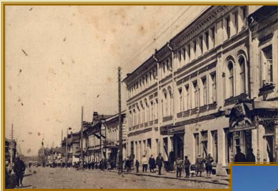
Улица Московская. Гранд Отель.