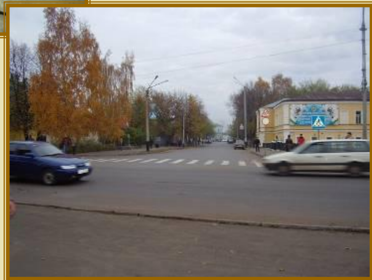
Въезд на вокзал