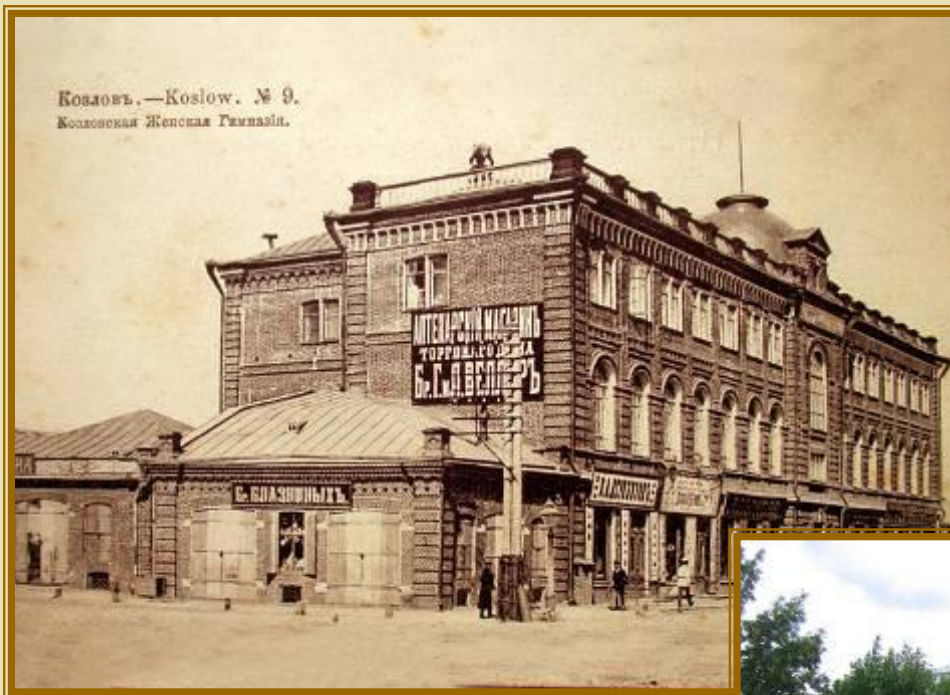
Казенная женская гимназия. 1902-1918.