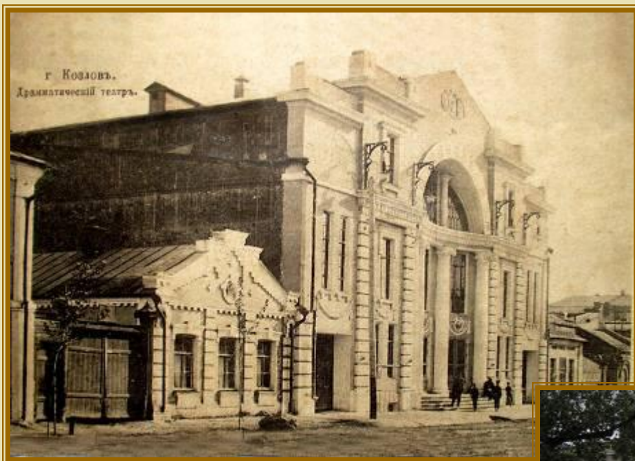
Театр разумных развлечений. 1913 г.