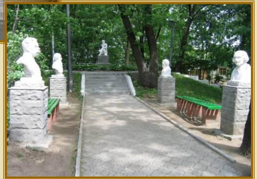
Городской парк культуры и отдыха