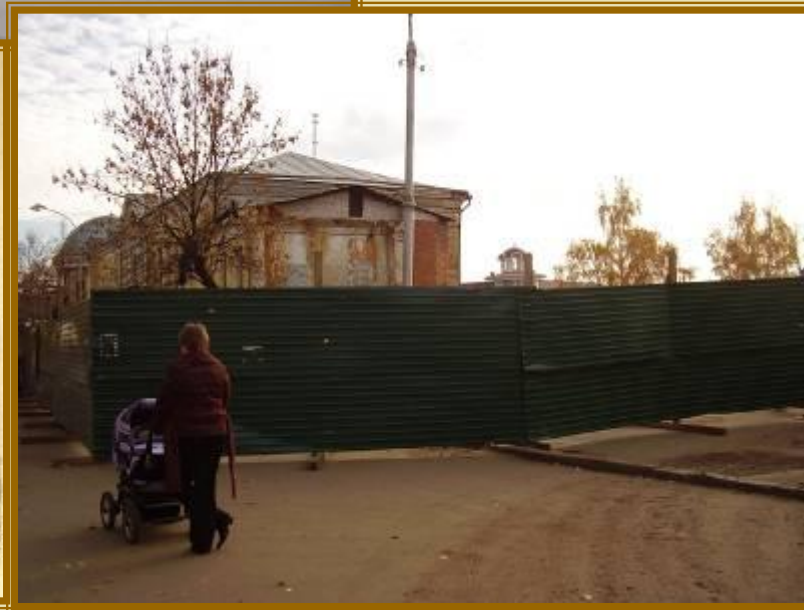
Галантерейный магазин Шишкина на Московской площади