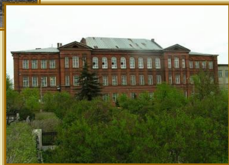
Мичуринский государственный аграрный университет