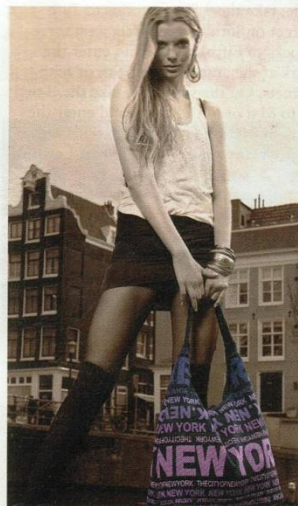
Robin Ruth's stylish accessories reflect the current fashion trends

Summer brings with it outdoor fun, and now's the time to shop for all your warm-weather needs. Whether you're shopping for gifts, supplies, or just embarking on some retail therapy, New York City can satisfy all of your shopping needs.