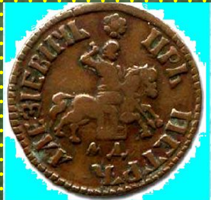
Медная копейка Петра I