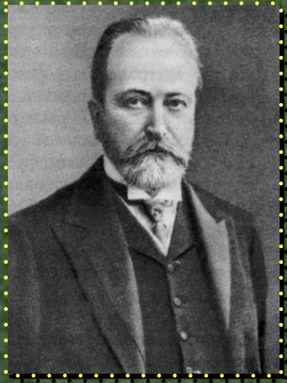
В.Н. Коковцов (1904-1914)

Выдающиеся министры финансов конца XIX – начала XX века