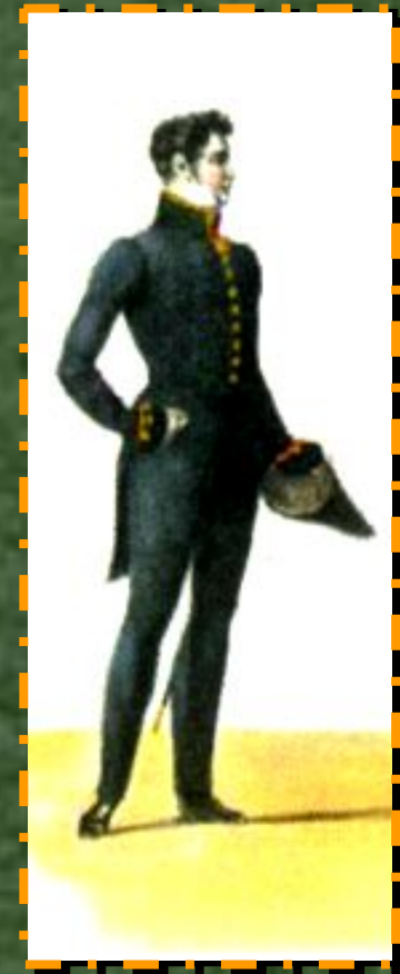
Мундиры чиновников разных классов министерства финансов начала XIX века