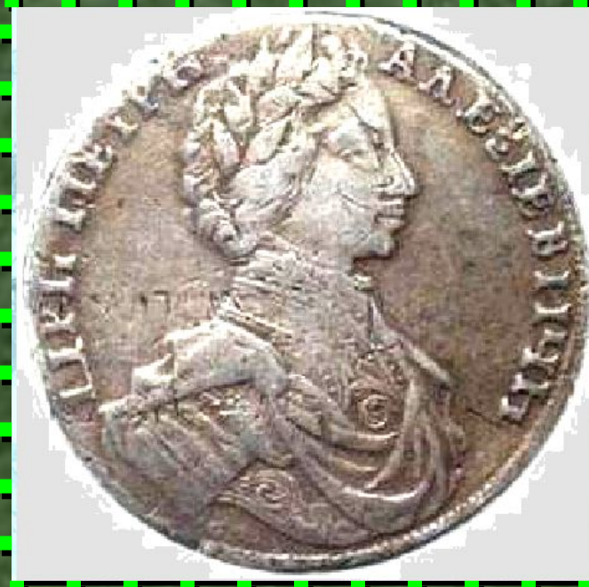
Серебряный рубль Петра I

Эти монеты впервые введены в обращение в начале XVIII в.