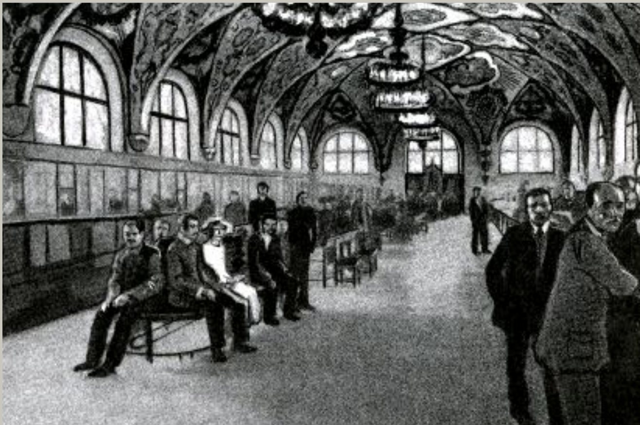
Операционный зал Московской конторы Государственного банка