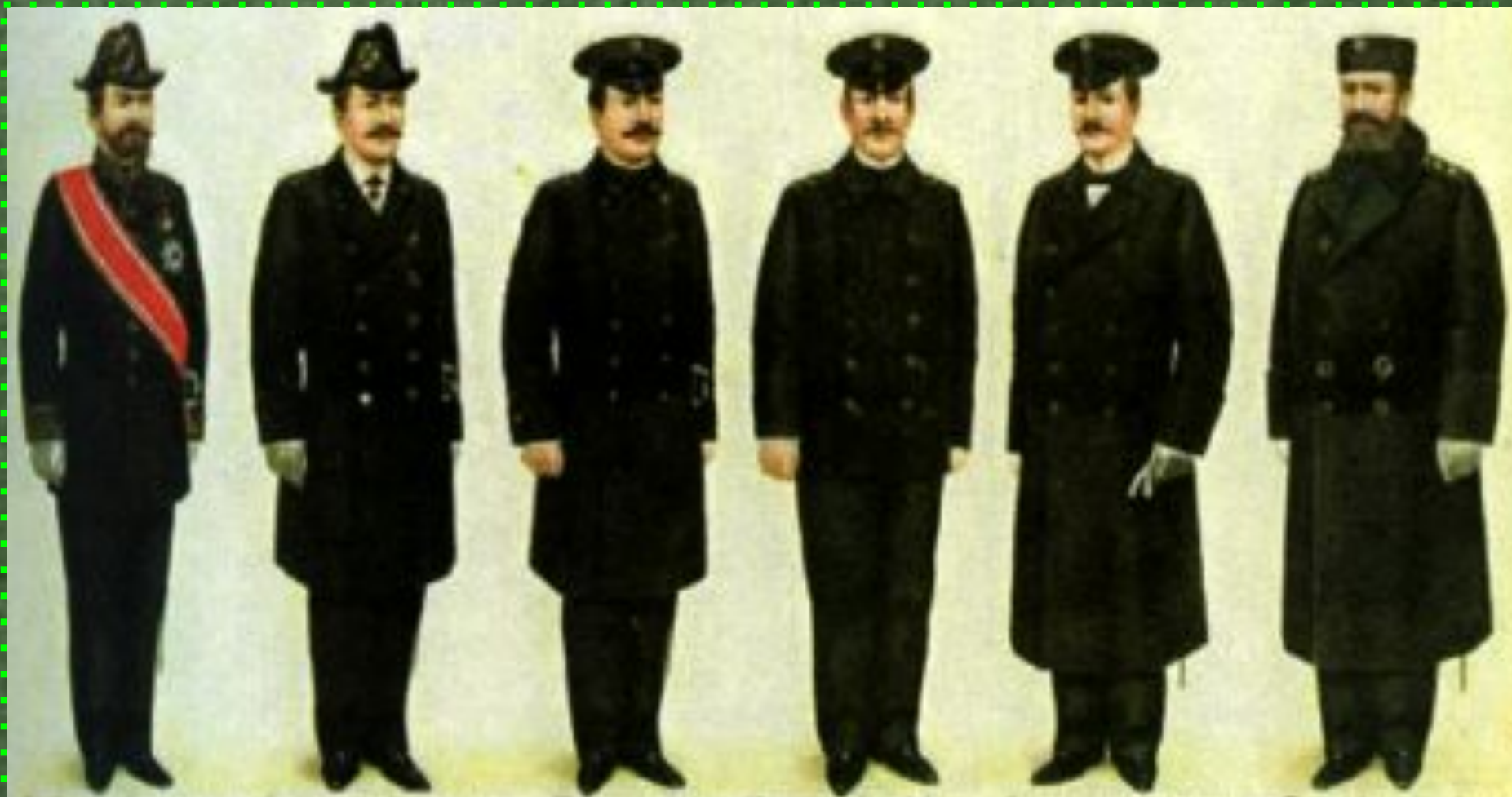
Мундиры чиновников разных классов министерства финансов начала XX века