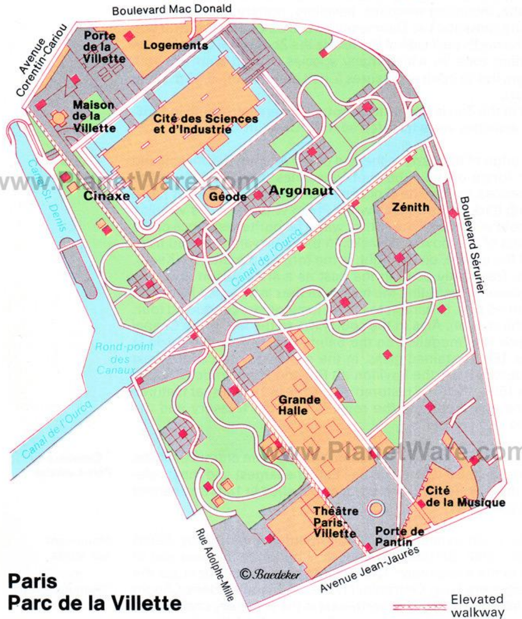
Paris Parc de la Vilette