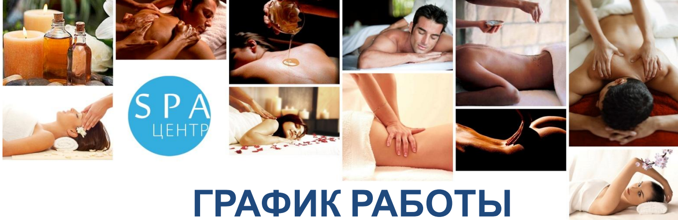
ГРАФИК РАБОТЫ кабинета эстетического массажа