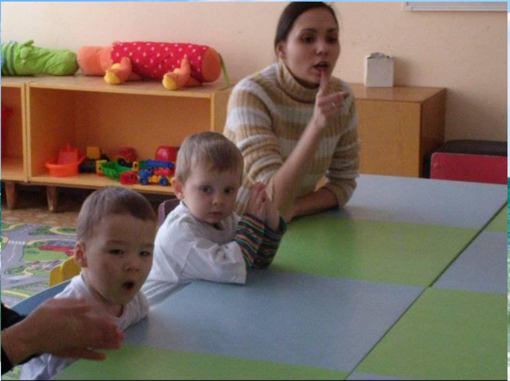
Пальчиковая гимнастика, развитие речи.