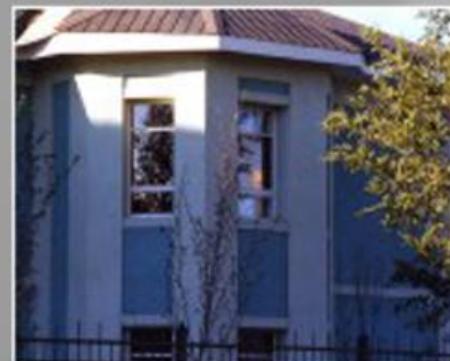
- Гостиница «Валгалла» (г. Мурманск)