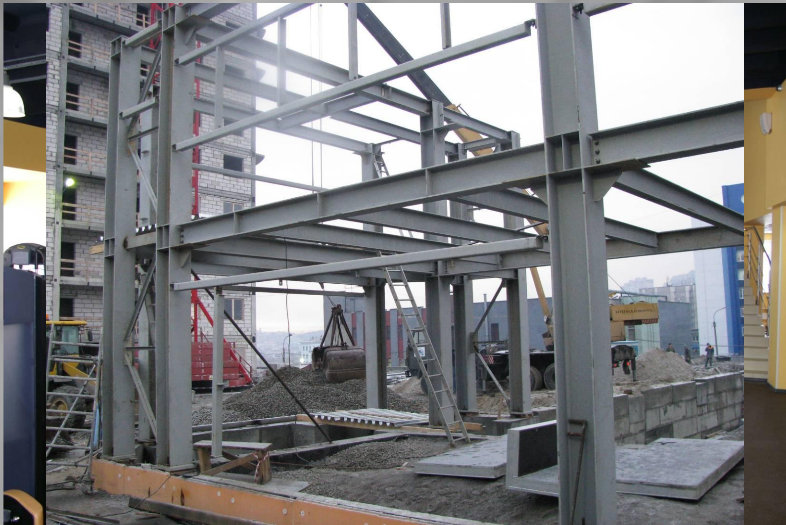
- Реконструкция спортивно-оздоровительного центра по ул. Буркова