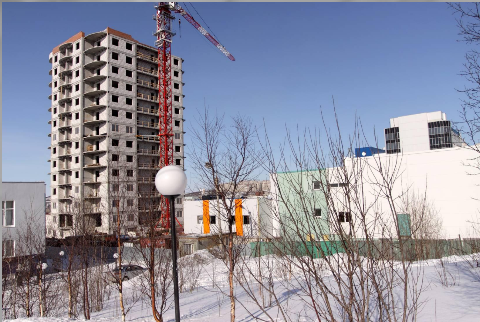
- Многоэтажный жилой дом со встроенными административными помещениями