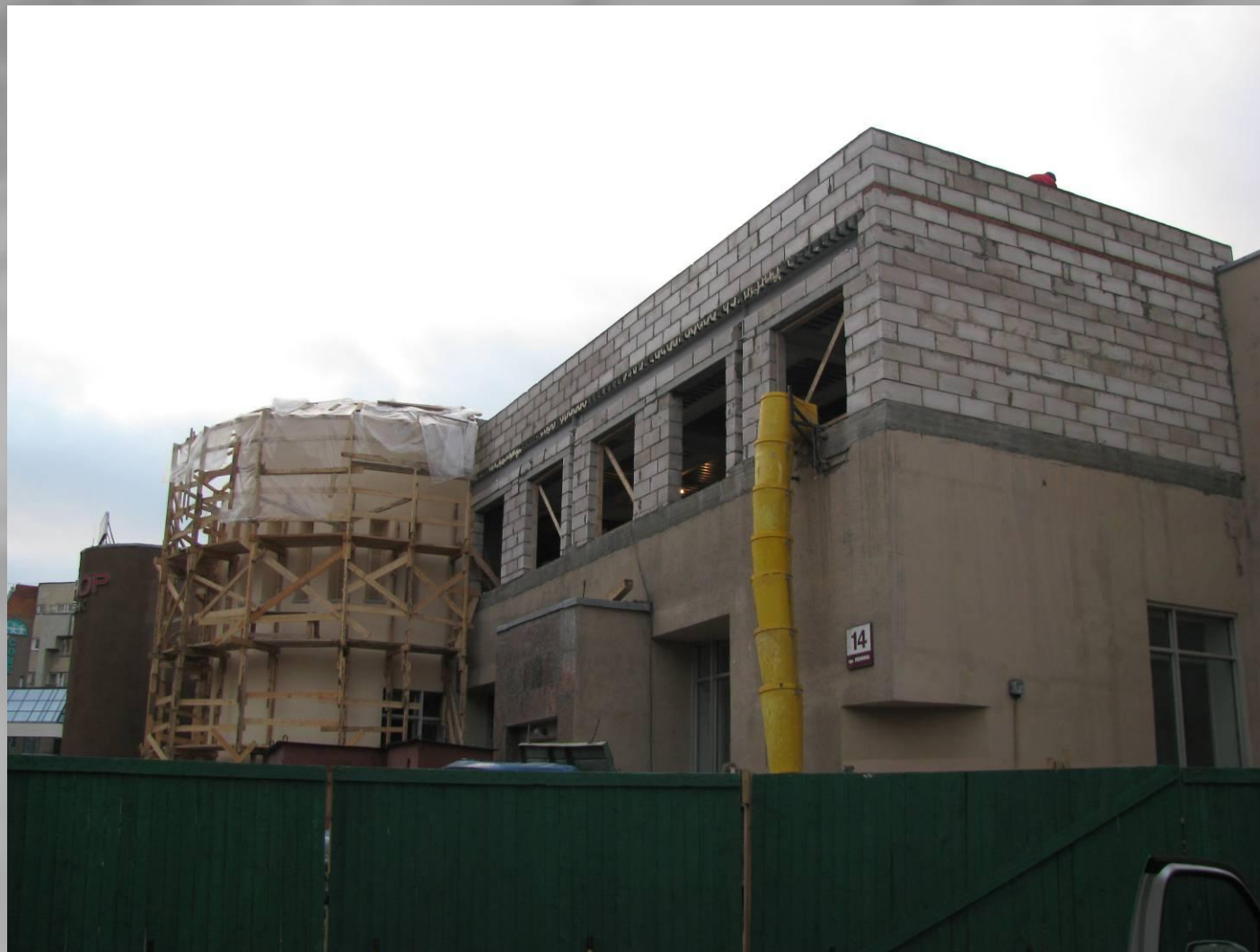
- Надстройка здания детского театрального центра (г. Мурманск)