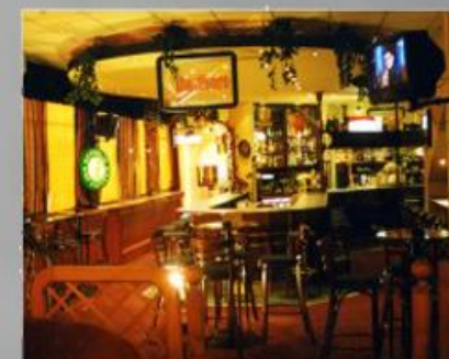
- Гостиница «Полярные Зори» (г. Мурманск)