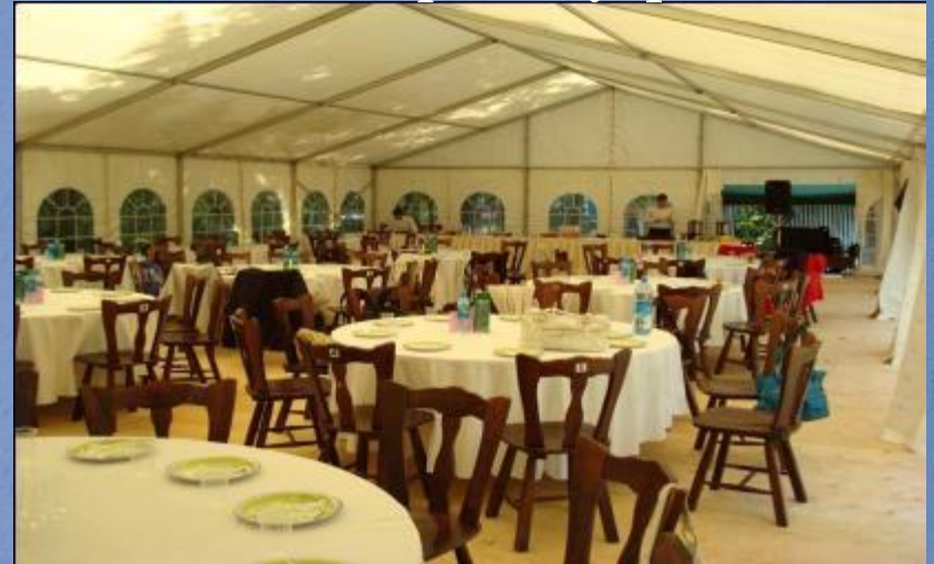
Вид шатра изнутри