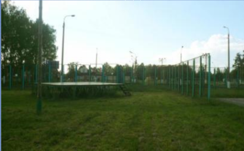
Баскетбольная и волейбольная площадки