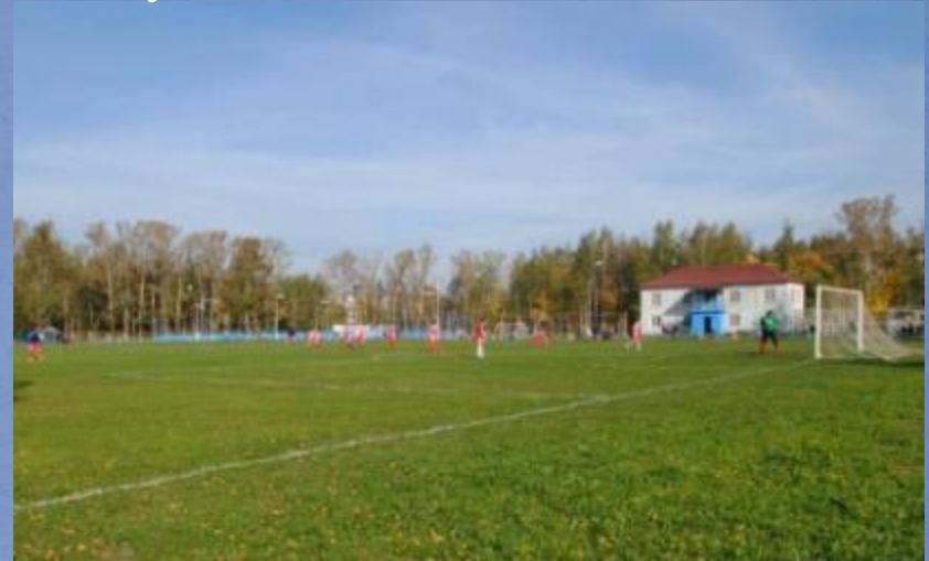
Футбольное поле с газоном