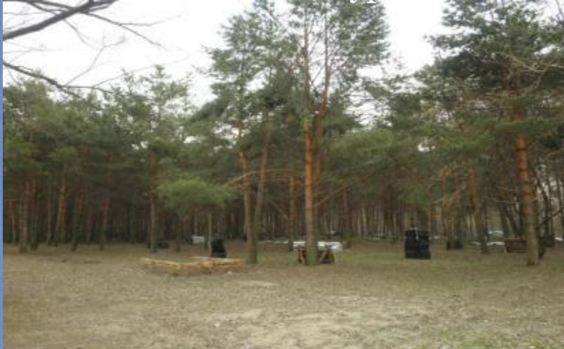
Сосновый бор для пейнтбола и верёвочного курса