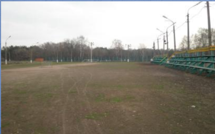
Тренировочное футбольное поле