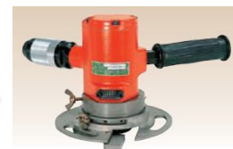
FBM-1-1, 2 FBM-1-1'S