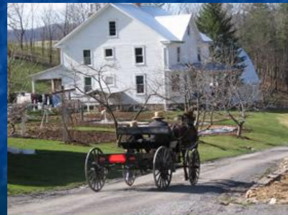
Amish Village in Rural Pennsylvania