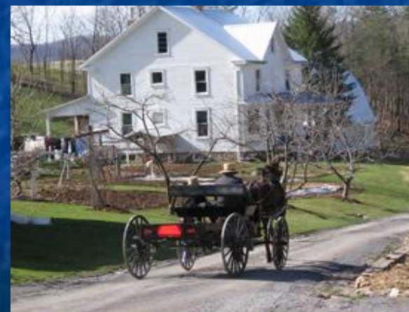
Amish Village in Rural Pennsylvania