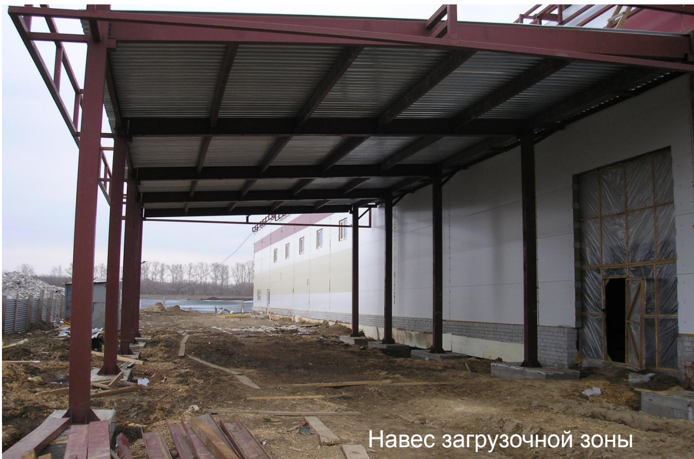
Навес загрузочной зоны