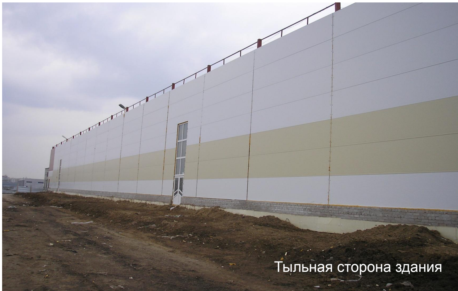
Тыльная сторона здания