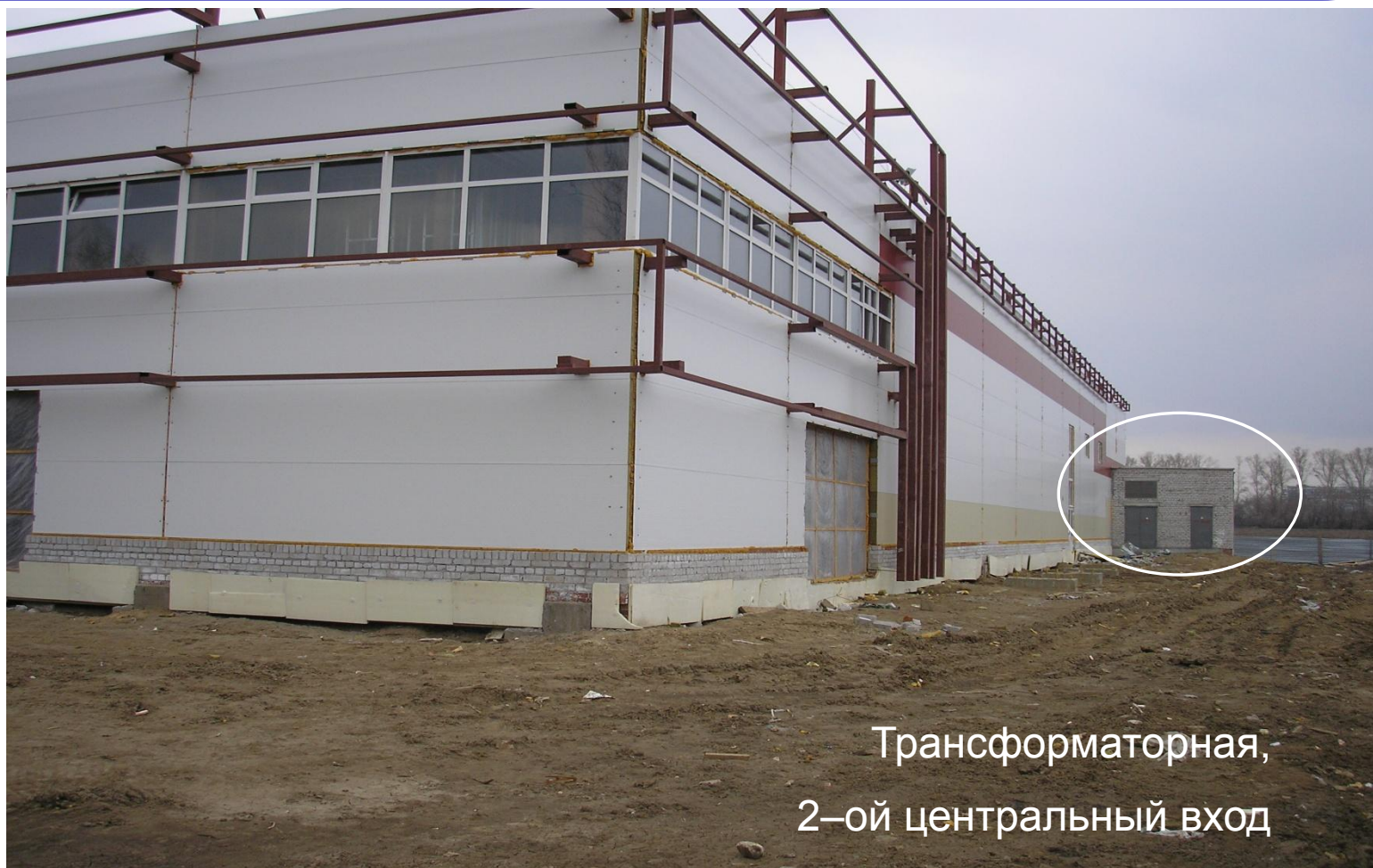
Трансформаторная, 2-ой центральный вход