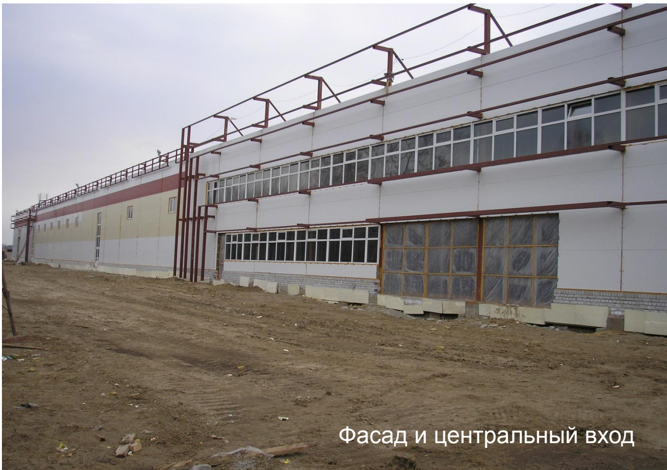
Фасад и центральный вход