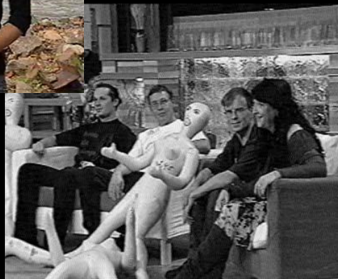
Певица Лолита и участники Bubble Baba Challenge – 2003 в передаче «Большая стирка»