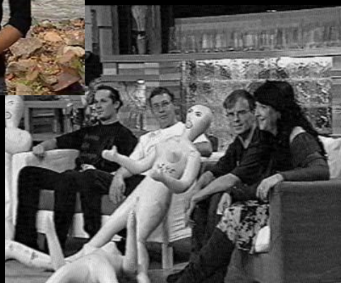
Певица Лолита и участники Bubble Baba Challenge – 2003 в передаче «Большая стирка»