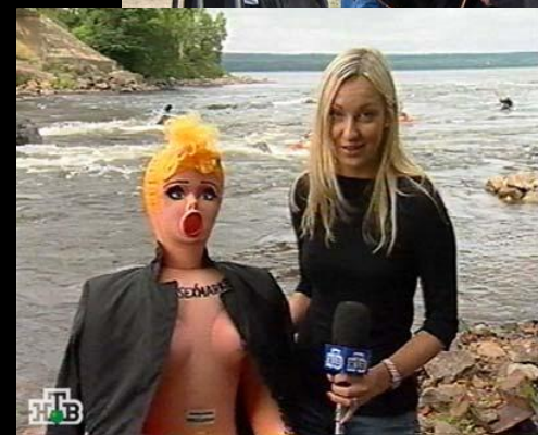
Кадр из репортажа на «НТВ»