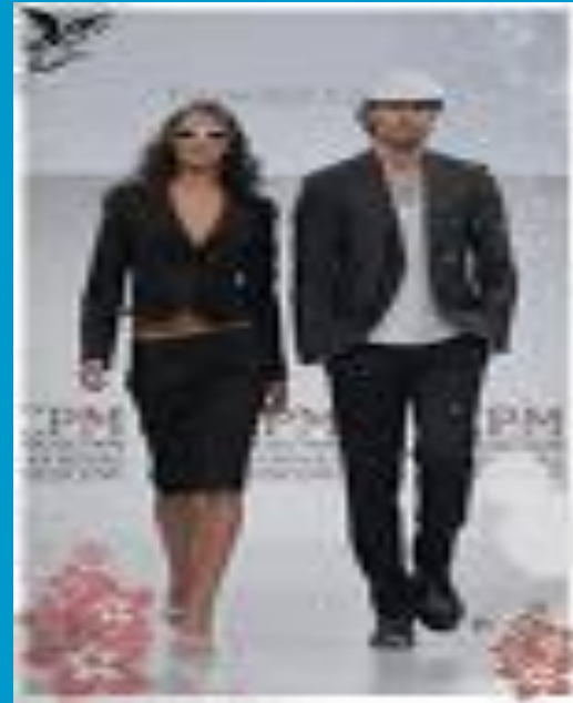
Головные уборы: вязаные шапочки, шапки-ушанки