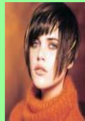
Использование прядей разной длины