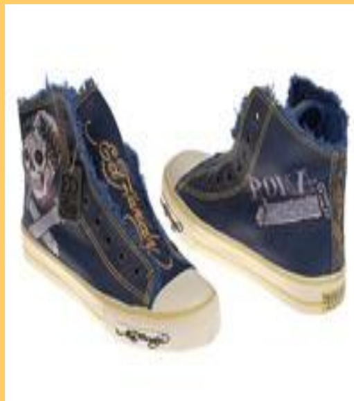
Кеды с принтами