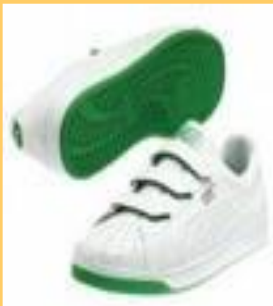
Кроссовки фирмы Glamsport