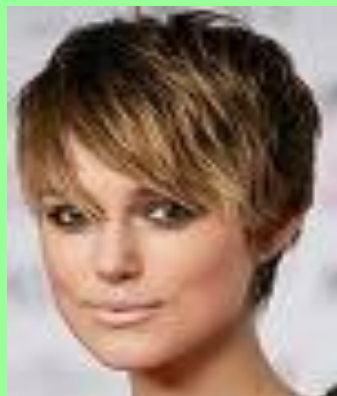
Модно этой осенью