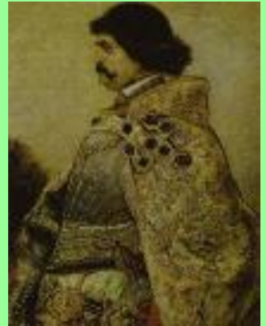
Эпоха Ивана Грозного