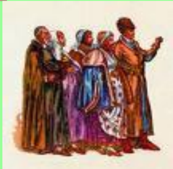
Горожане 18 века