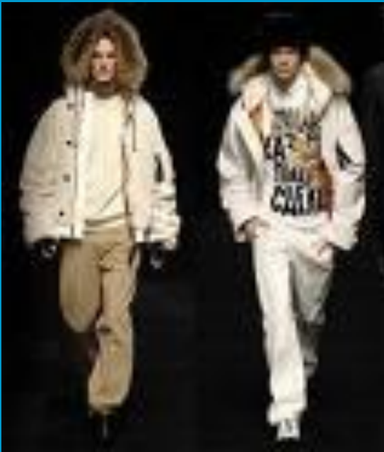
Пуховики и куртки с мехом