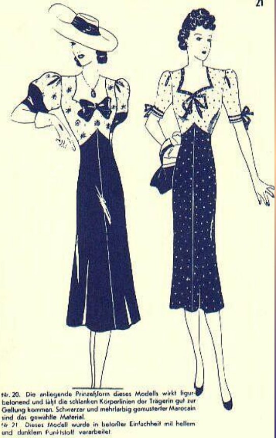
Nr. 20. Die anliegende Prinzessform dieses Modells wirkt figur-betonend und läßt die schlanken Körperlirien der Trägerin gut zur Geltung kommen. Schwarzer und mehrfarbig genusterter Marocain sind das gewählte Material. Nr. 21. Dieses Modell wurde in betörter Einfachheit mit hellem und dunklem Funtistoff verarbeitet.