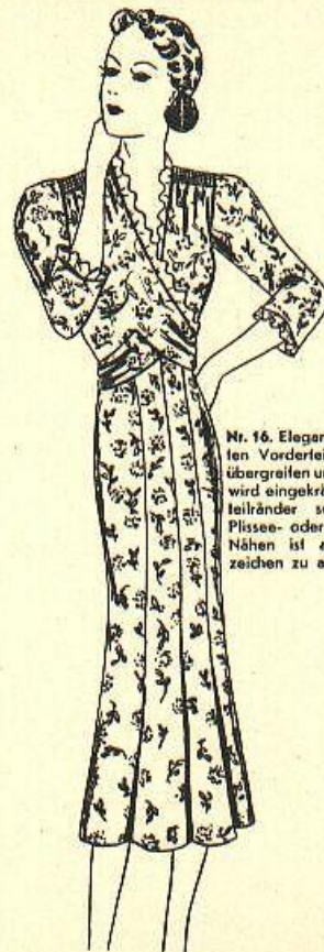
Nr. 16. Elegantes Kleid mit interessanten Vorderseiten, die nach rückwärts übergrafen und schließen. Die Schulter wird eingekräuselt. Ärmel und Ober-teilränder schließen mit schmalen Plissee- oder Volanrüschen ab. Beim Nähen ist auf die Zusammensetz-zeichen zu achten.