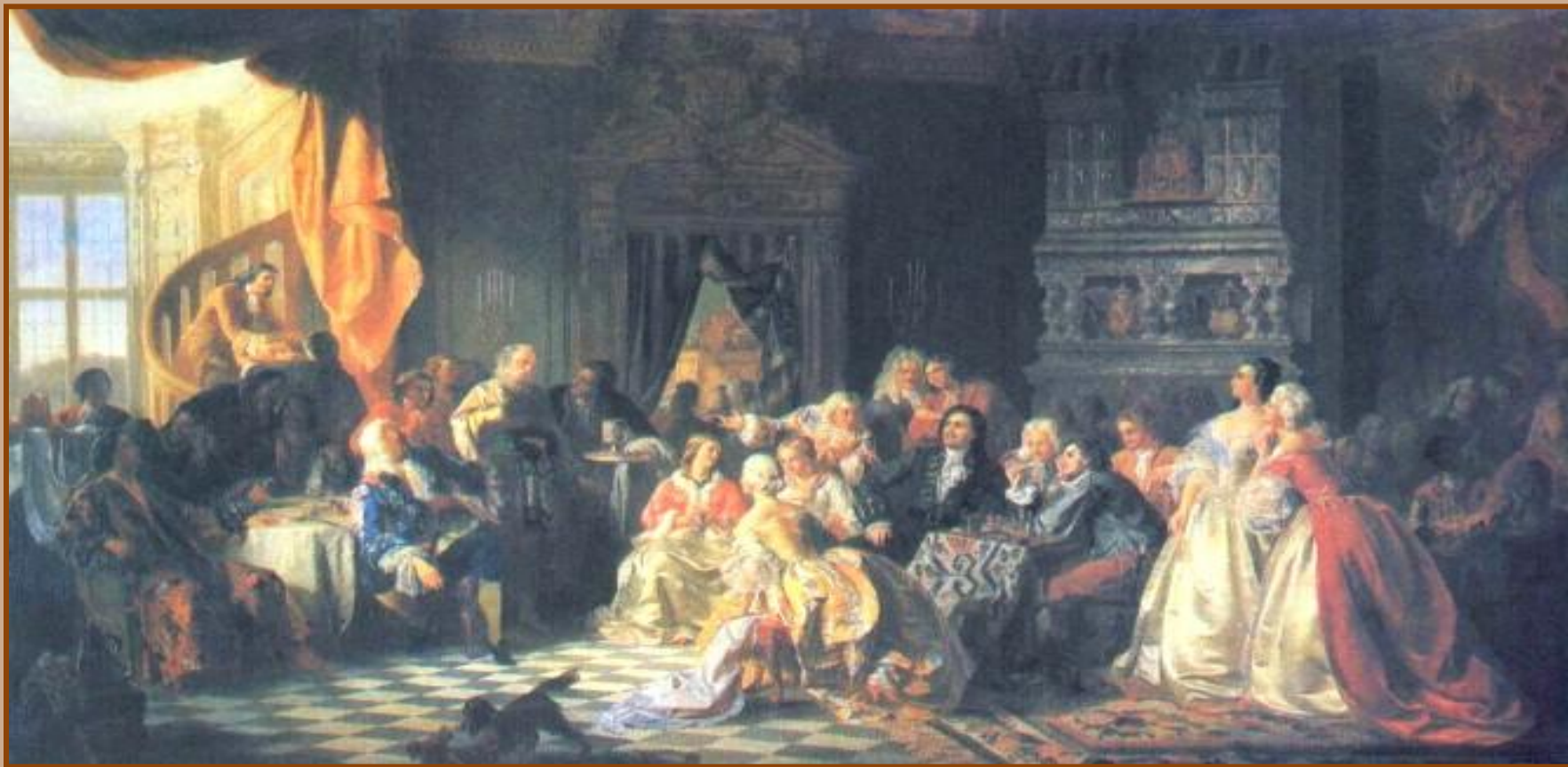
Ассамблея при петре I

В начале XVIII века с реформами петра I в Россию начала проникать и Заграничная мода. Постепенно стали меняться облик, одежда, интересы И нравы русских людей.