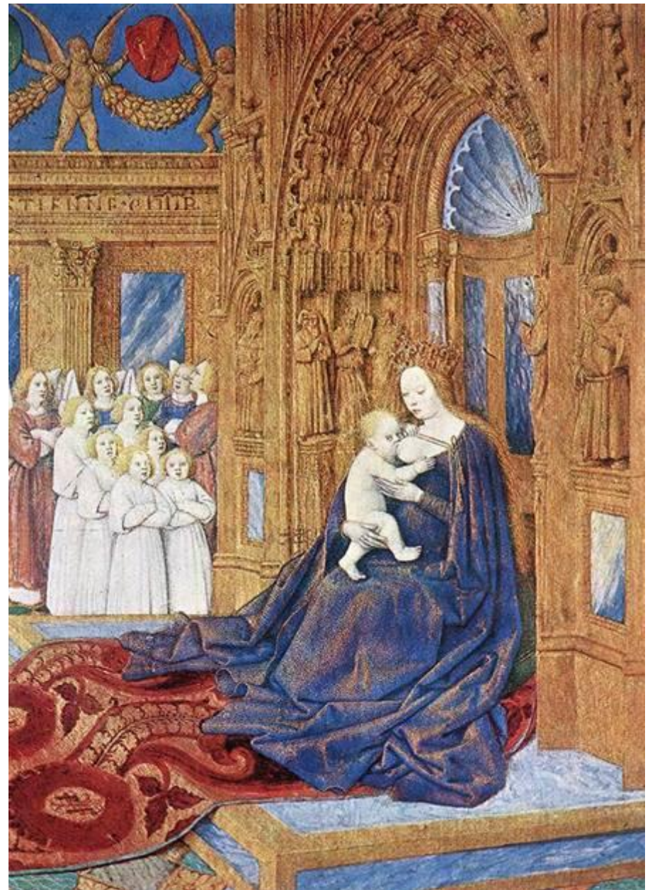
Жан Фуке Часослов, 1450