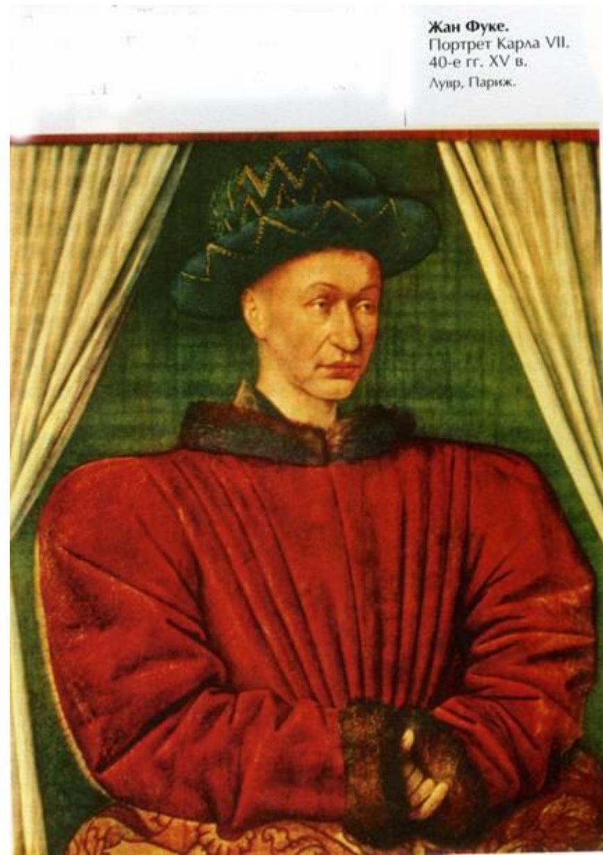
Жан Фуке. Портрет Карла VII. 40-е гг. XV в. Лувр, Париж.