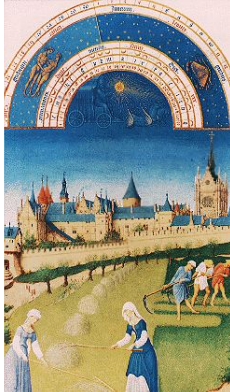
Братья Лимбурги «Часослов Герцога Беррийского» 1411-1416