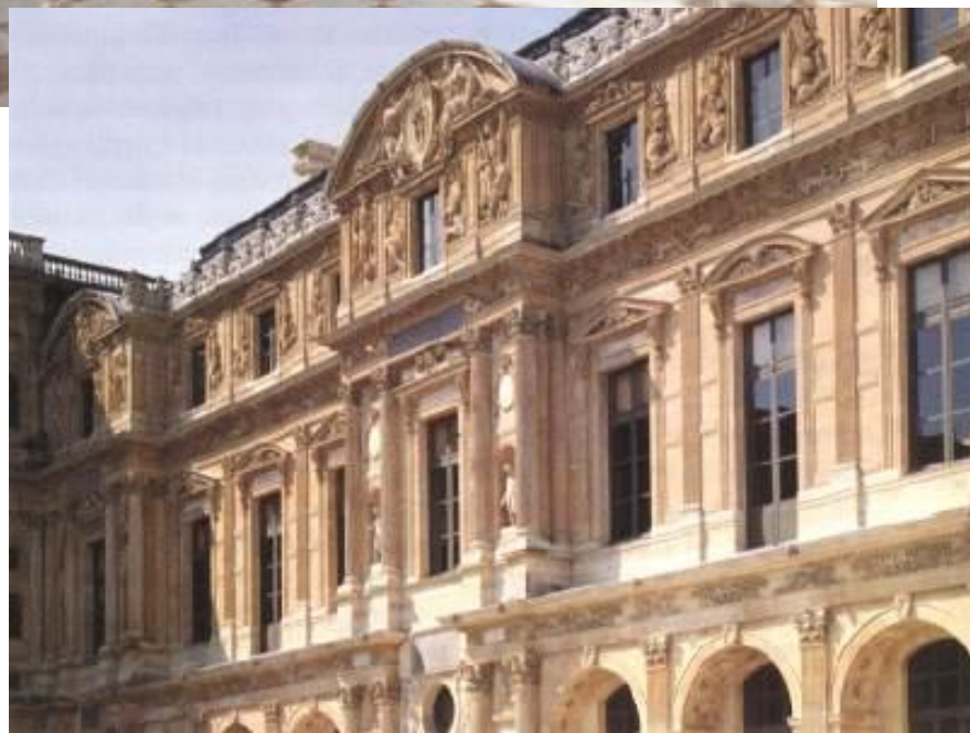
Жан Гужон (1510-1568) скульптор нового Лувра