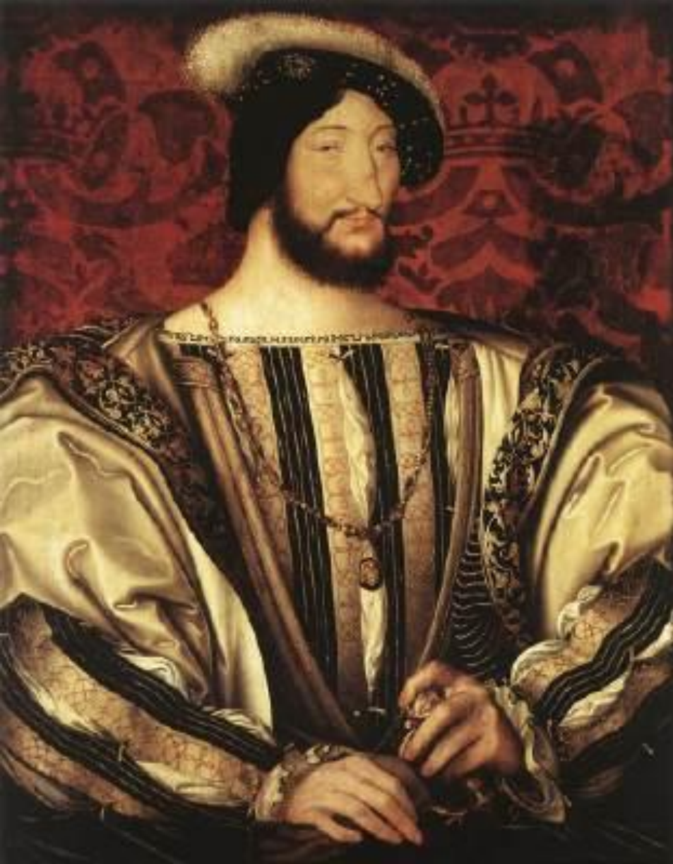
Жан ФУКЕ (1420-1481) – Придворный живописец Карла VII