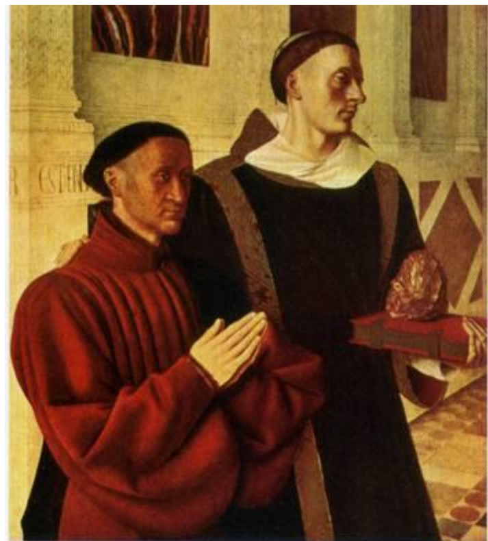
Жан Клуэ, Святой Стефан и заказчик