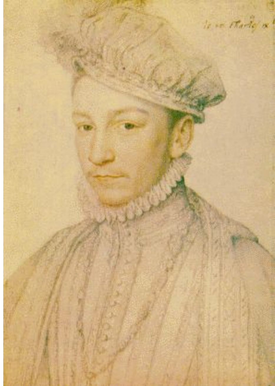
Жан КЛУЭ, карандашные портреты