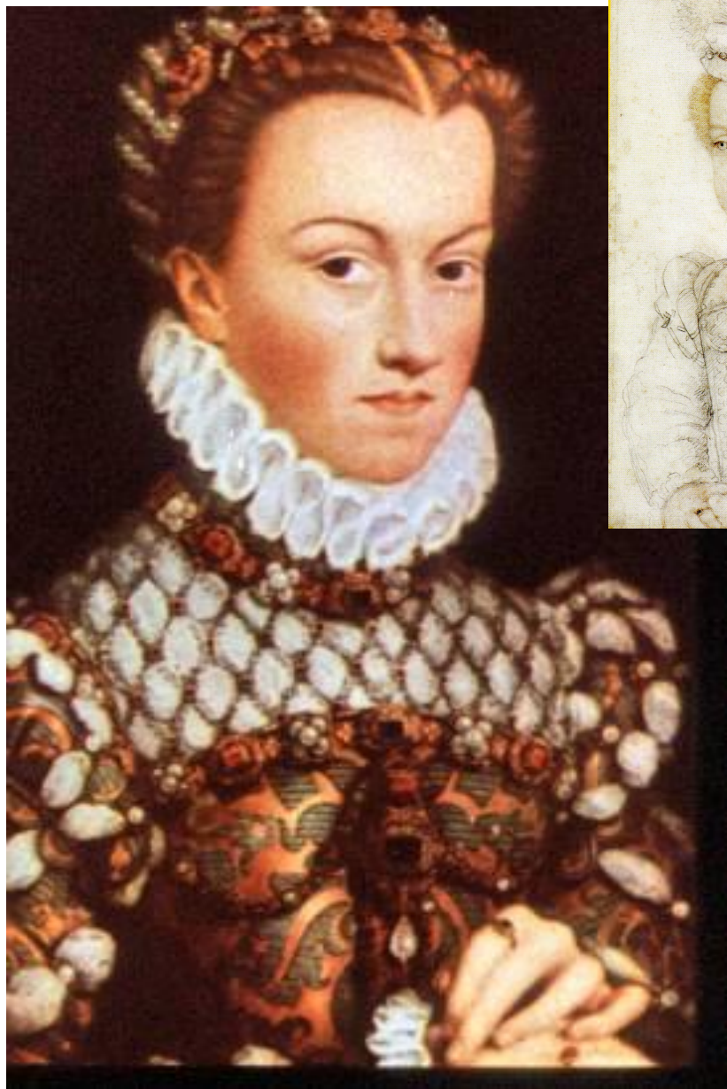
Портрет Елизаветы Австрийской