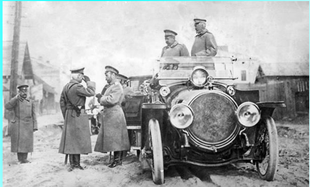
Князь Орлов и Николай II

В начале марта 1907 года был основан гараж Николая II.