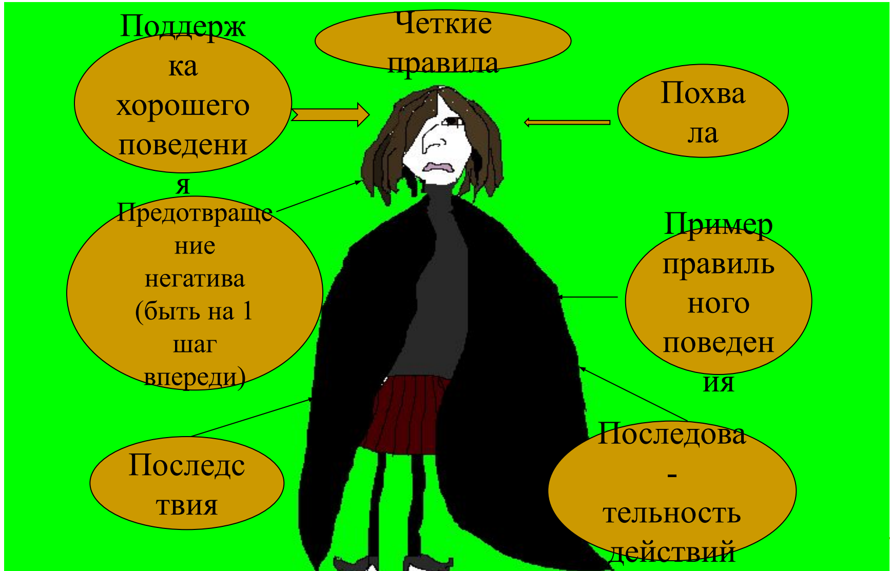
Схема управления поведением ребёнка