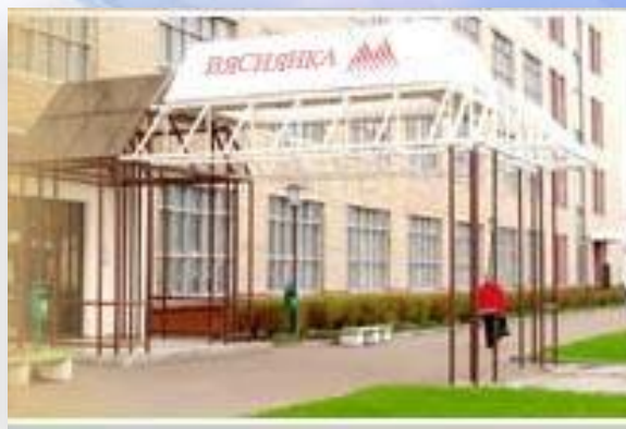
ЗАО МШФ «Вяснянка»