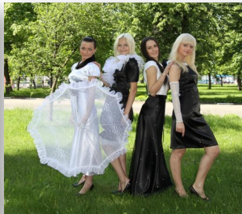
Студия моды «Грация и пластика»