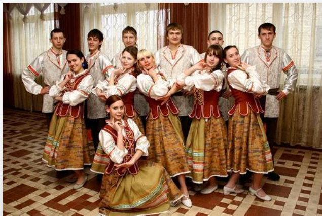
Танцевальный коллектив «Маладосць»