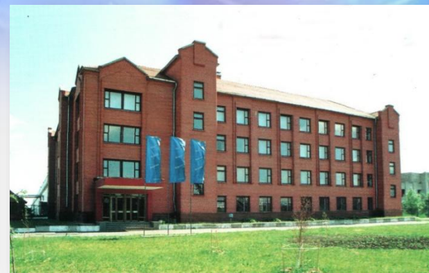
ЗАО СП «Сопотекс»