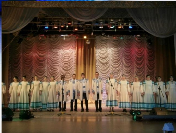
Хоровой ансамбль «Раніца»