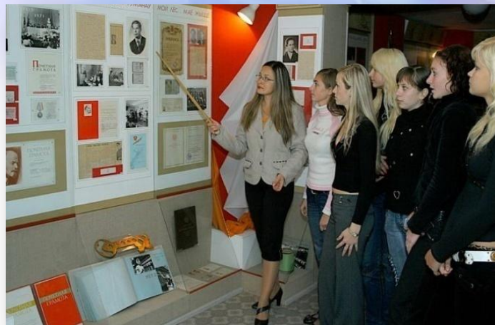
Кружок музейного дела