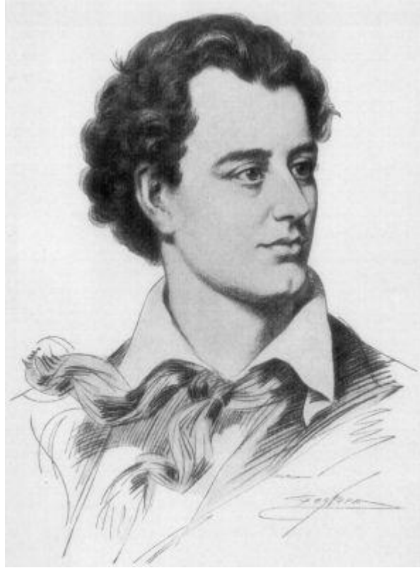
Джордж Гордон Ноэль Байрон