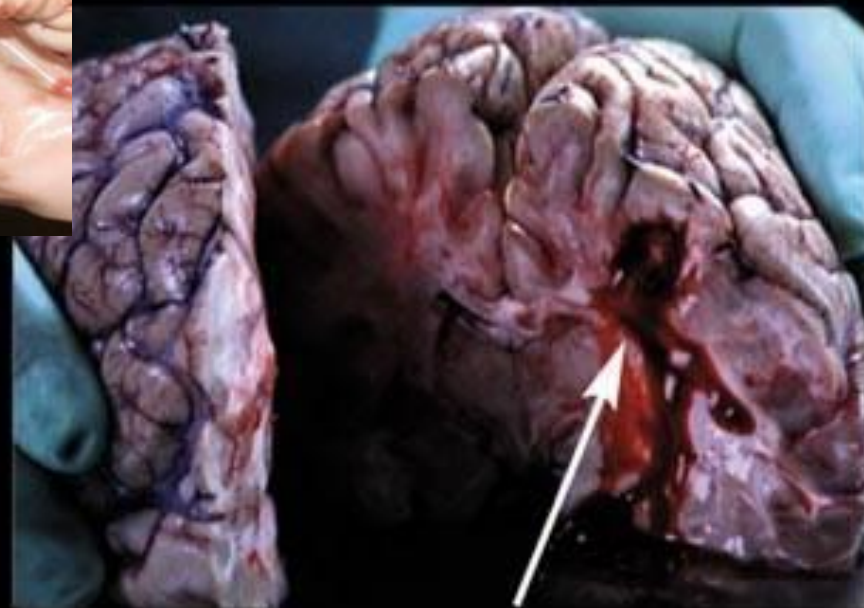
human brain with stroke