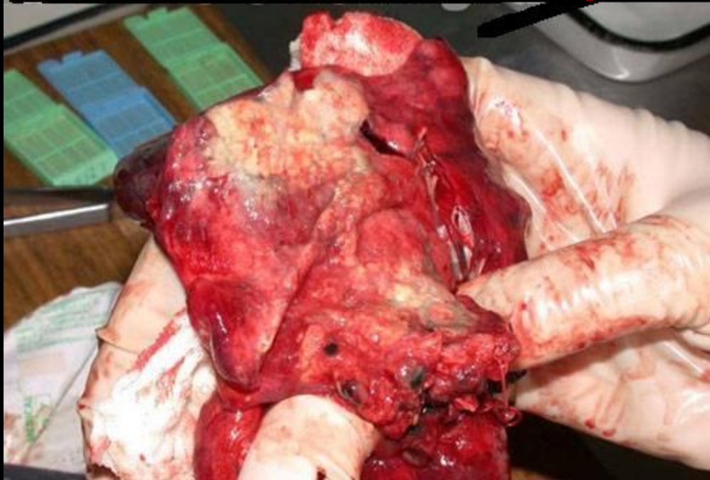
Сердце курильщика со стажем