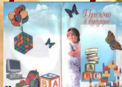
Поздравительная открытка родителям от губернатора СК Черногорова А.Л., 2002 год