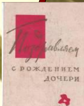
Поздравительная открытка родителям, 1975 год