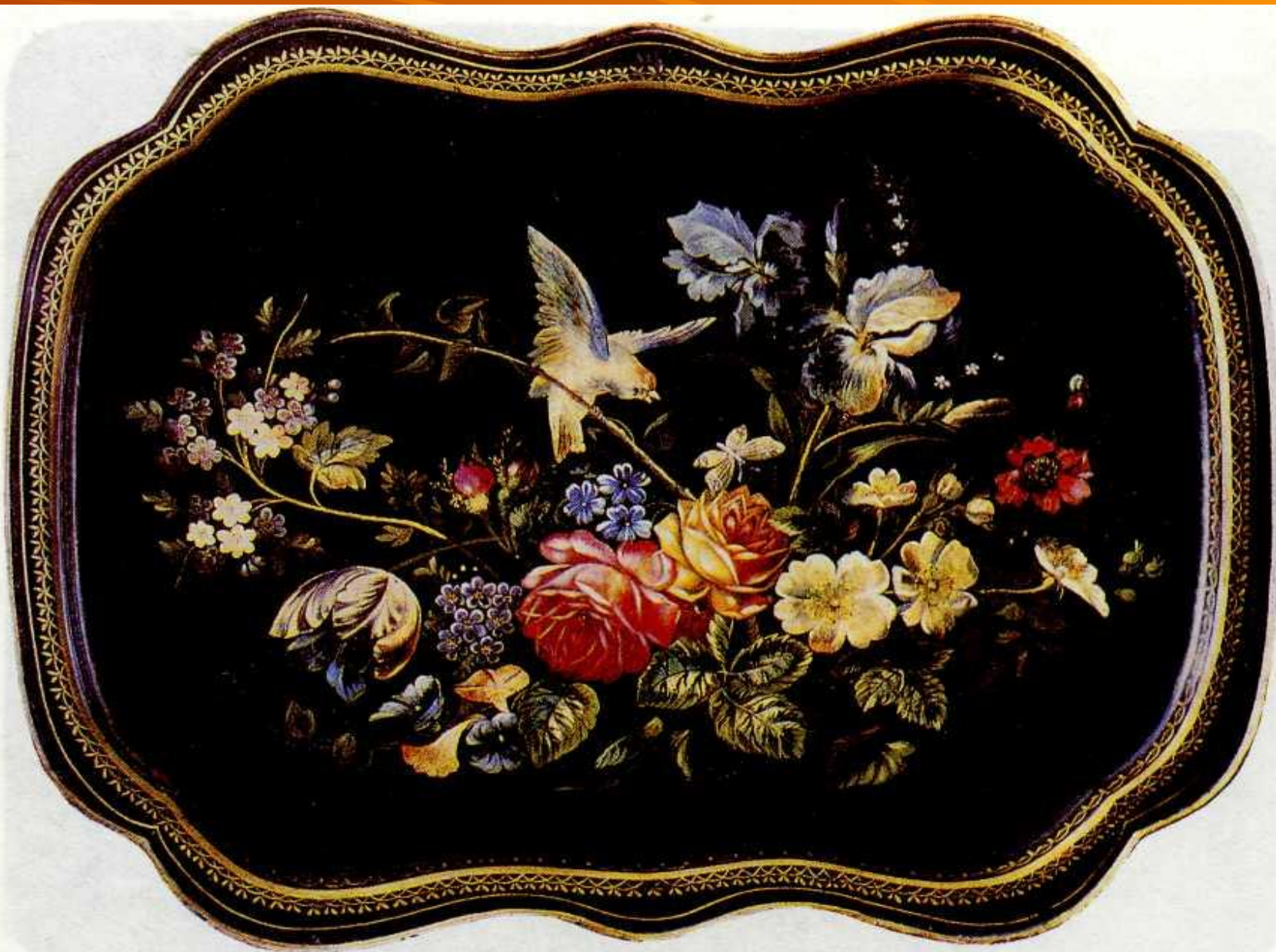
П. И. Плахов. Поднос. Жостово