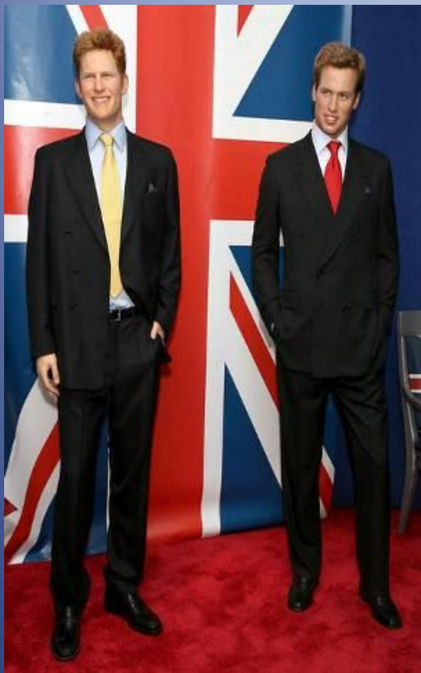
Гарри и Уильям в музее Мадам Тюссо