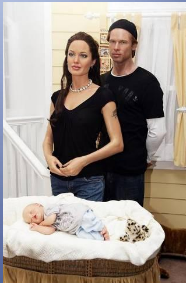
Анджелина Джоли и Бред Питт со своей дочерью в музее Мадам Тюссо