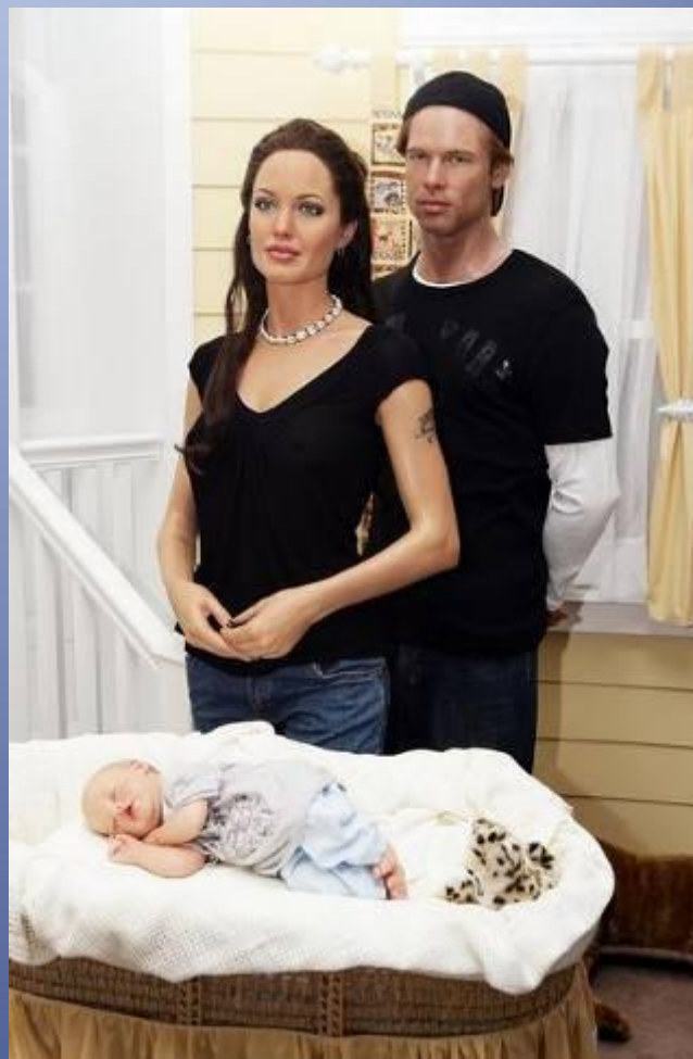
Анджелина Джоли и Бред Питт со своей дочерью в музее Мадам Тюссо