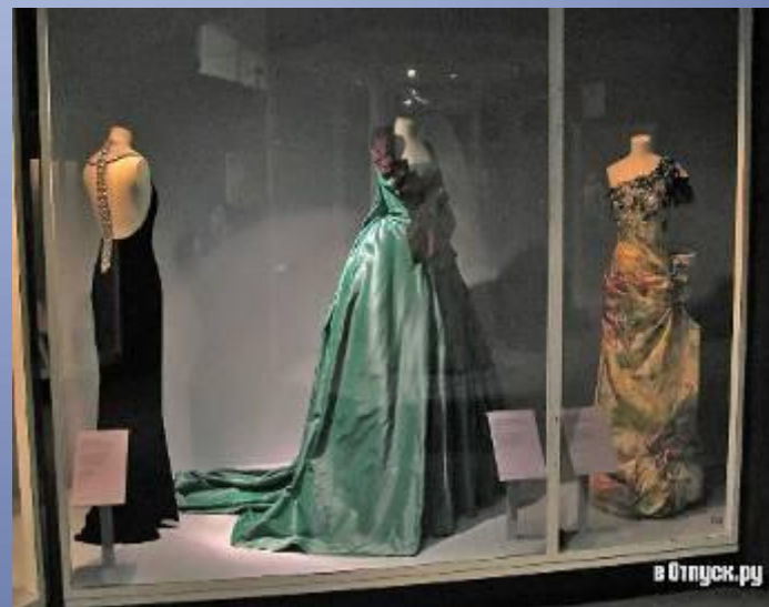
Музей Виктории и Альберта в Лондоне