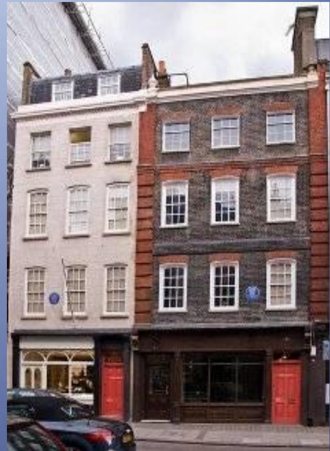
Дом-музей Георга Фридриха Генделя