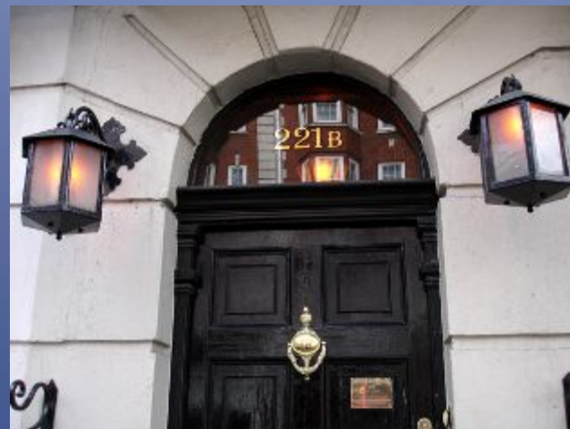
Дом-музей Шерлока Холмса