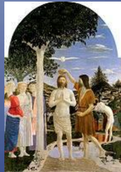
Национальная галерея Лондона