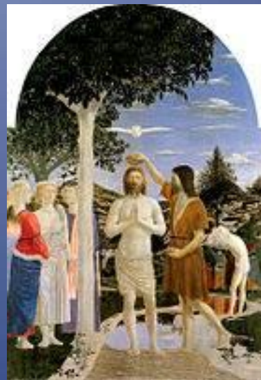
Национальная галерея Лондона