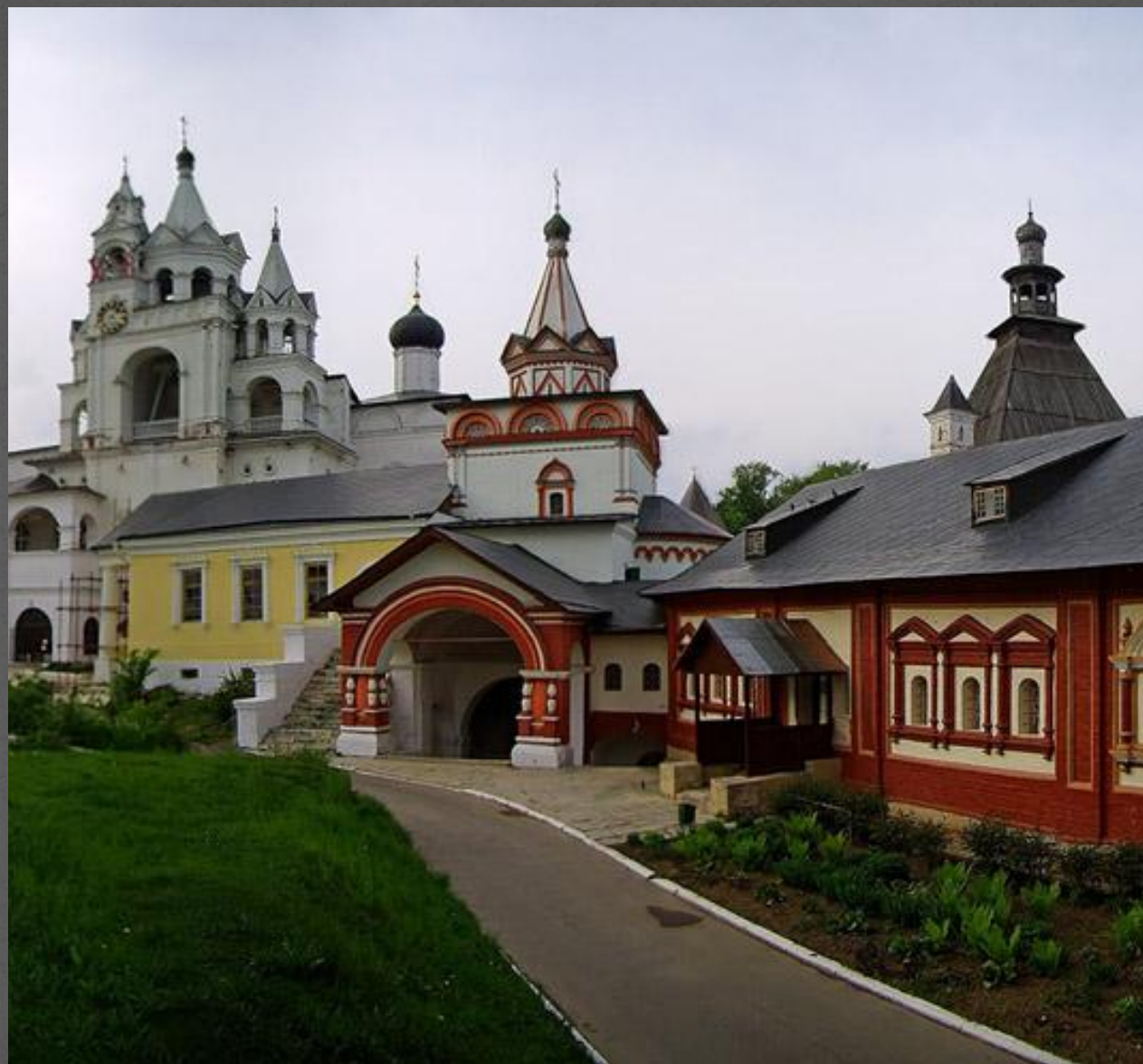
Архитектура и интерьер Московского княжества