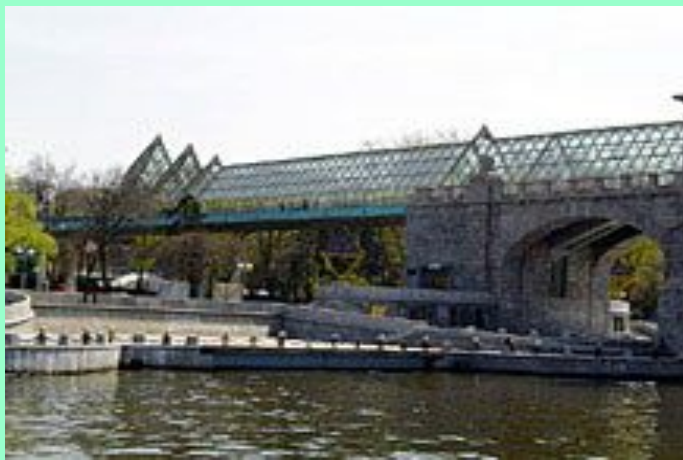
Москва. Андреевский мост у Нескучного сада.