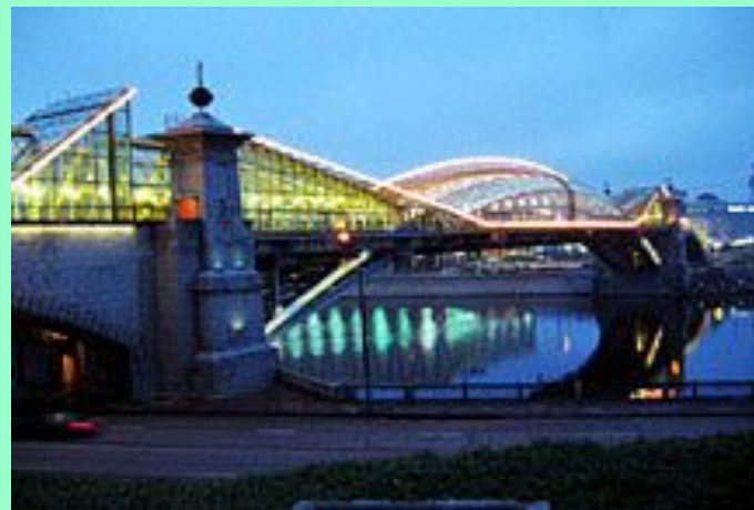
Москва. Мост Богдана Хмельницкого вблизи Киевского вокзала.