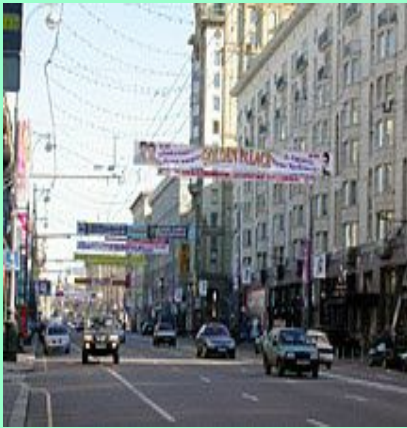
Главная улица российской столицы - Тверская