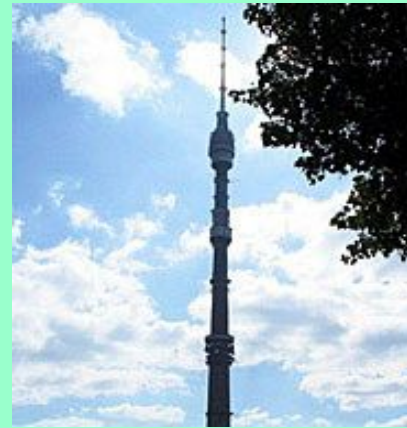
Останкинская телебашня является самой высокой башней в Европе (высота 450 м)