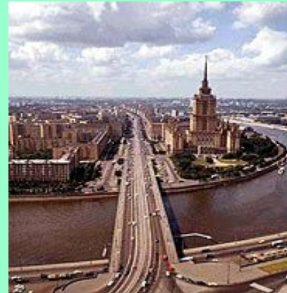
Кутузовский проспект. Одна из самых широких и красивых магистралей столицы