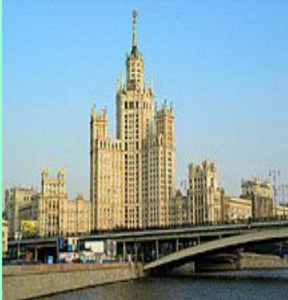
Высотное здание на Котельничес кой набережной