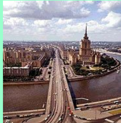
Кутузовский проспект. Одна из самых широких и красивых магистралей столицы