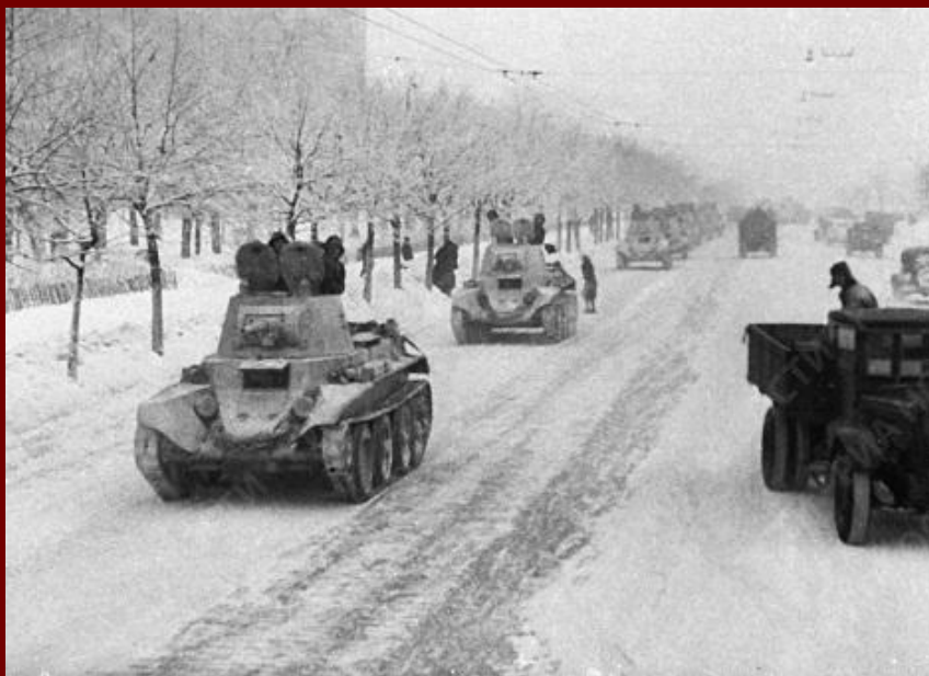
Танки идут на фронт по улицам Москвы