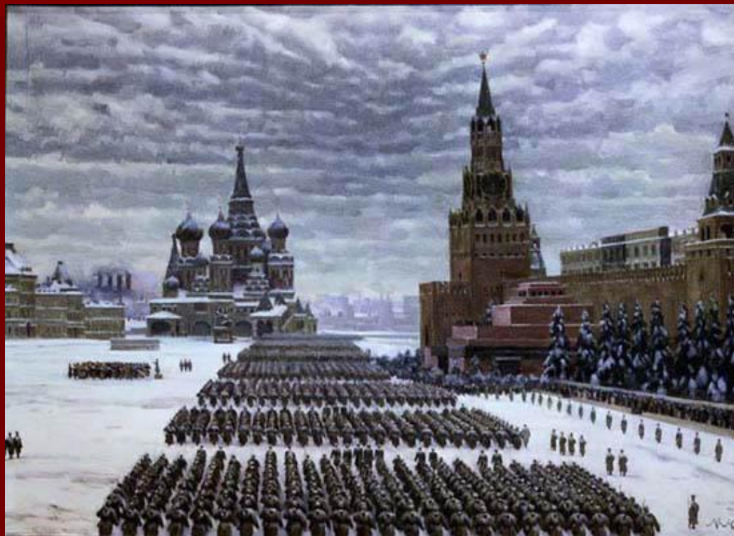
Красная площадь 7 ноября 1941 года