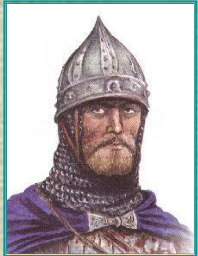
Дмитрий Боброк Волынский

Сам Дмитрий, переодевшись в доспехи простого ратника, стал в ряды воинов большого полка.