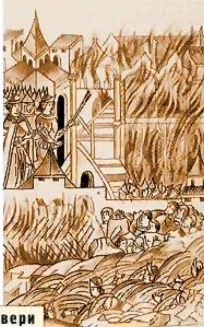
Восстание в Твери