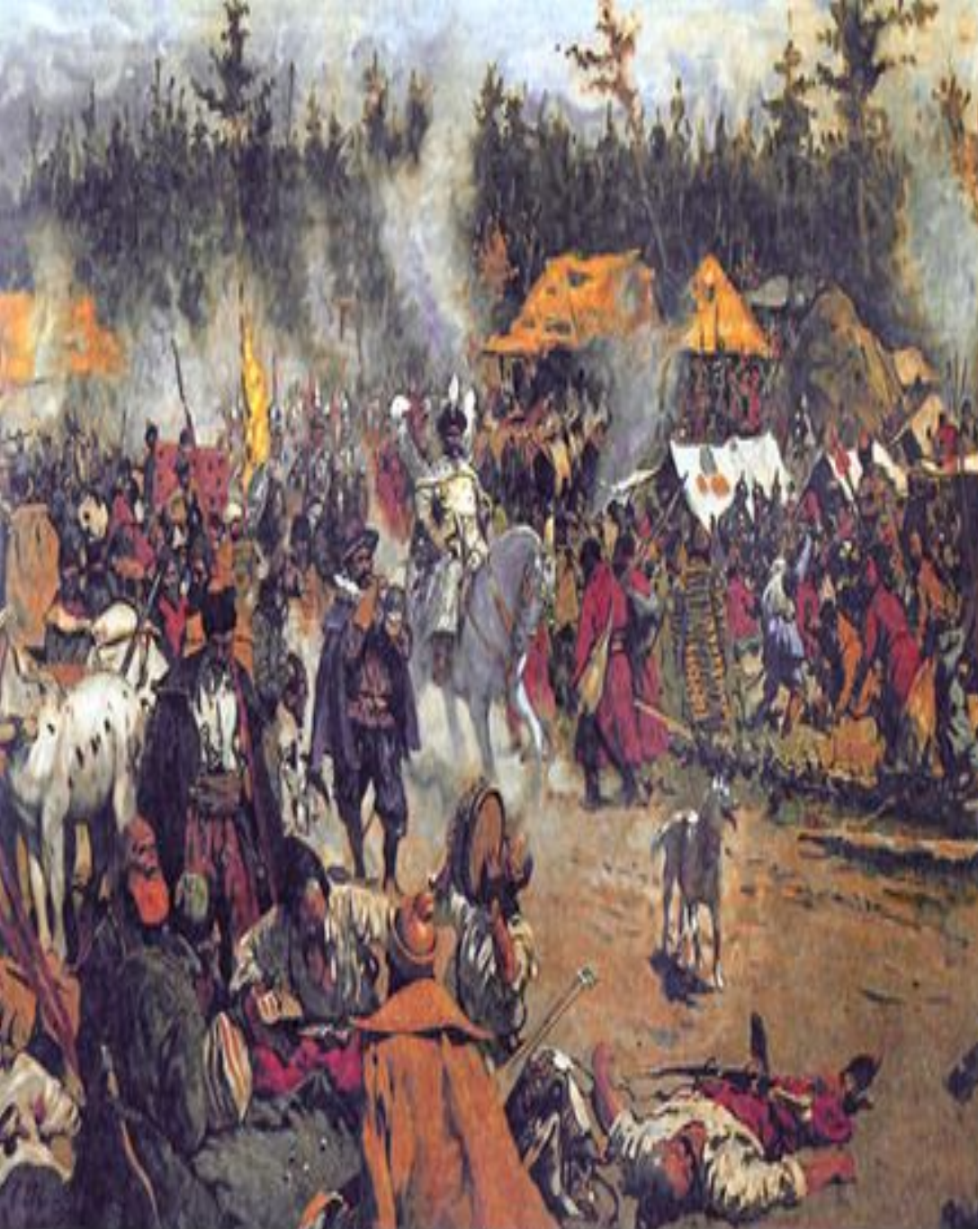
С.В. Иванов. "В смутное время"

Однако, грабежи и насилия, совершаемые польско-литовскими отрядами в русских городах, а также межрелигиозные противоречия между католицизмом и православием вызвали неприятие польского господства — на северо-западе и на востоке ряд русских городов «сели в осаду» и отказывались присягать Владиславу. Поляки, принявшие спор на рынке за начало восстания, устраивают резню в Москве, 7 тысяч москвичей погибает только в Китай-городе.