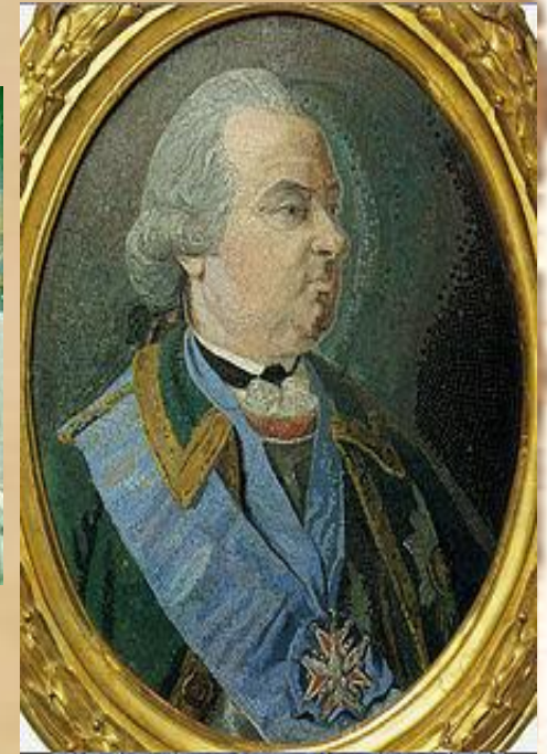
Портрет П.И. Шувалова 1785г. Эрмитаж