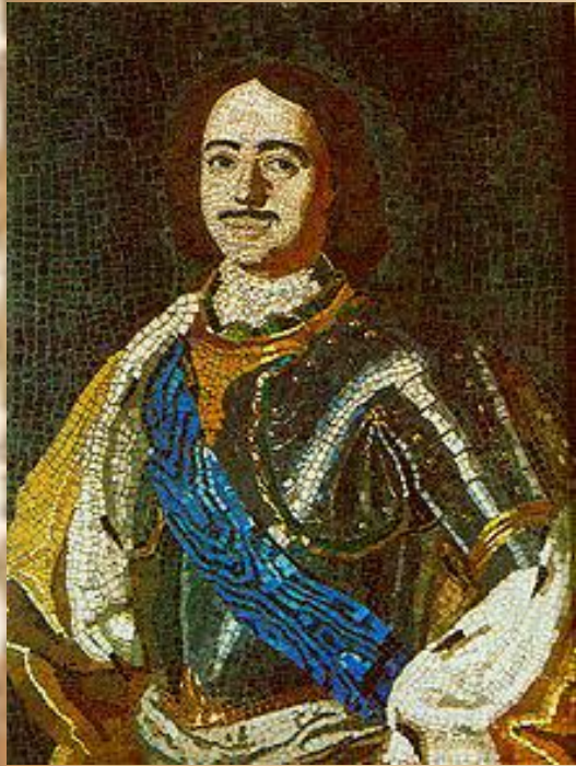
Портрет Петра I 1754 г. Эрмитаж