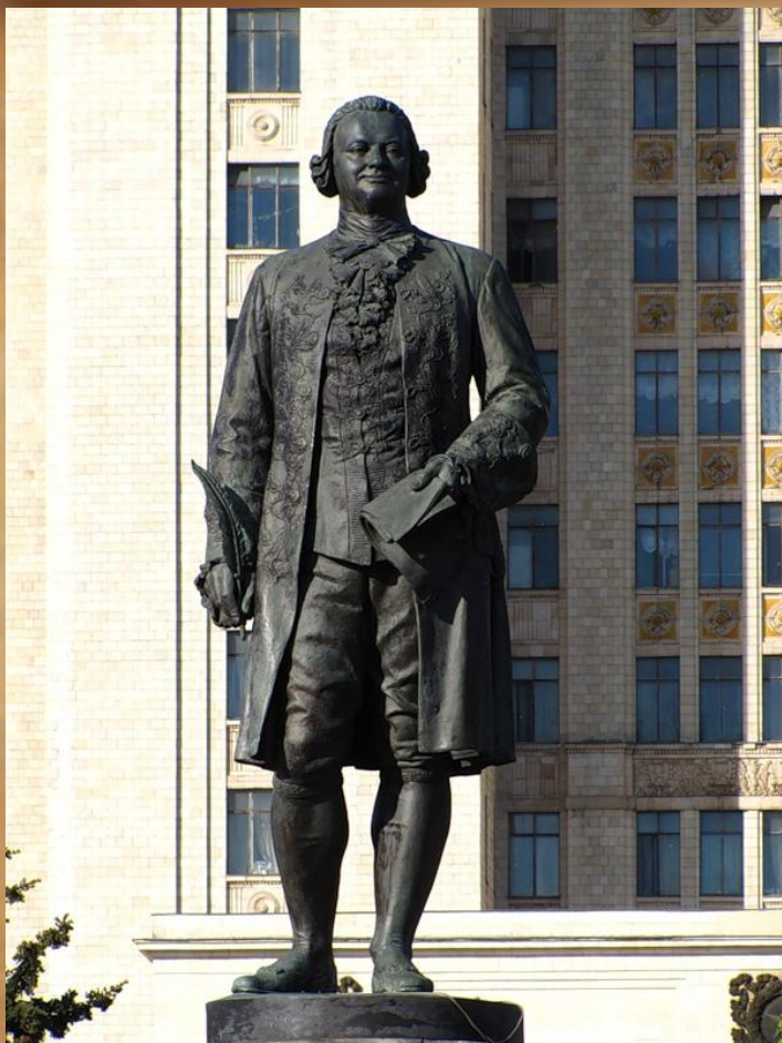
Вход в МГУ. Москва. Воробьевы горы