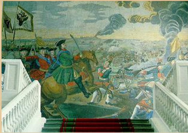
«Полтавская баталия». Санкт-Петербург 1762-1764