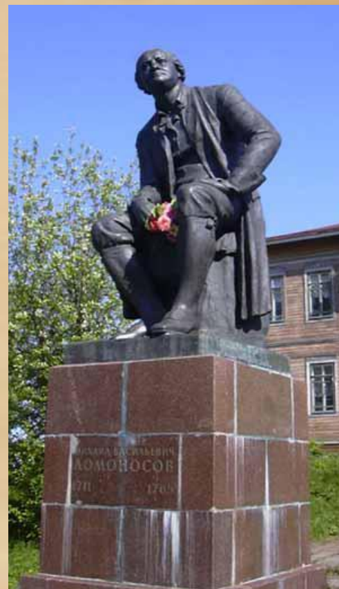
Архангельская обл. с. Ломоносово