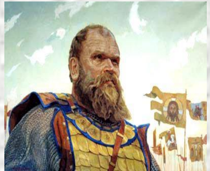
Боброк-Волынский Дмитрий Михайлович