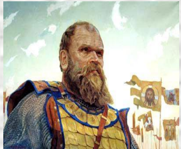
Боброк-Волынский Дмитрий Михайлович