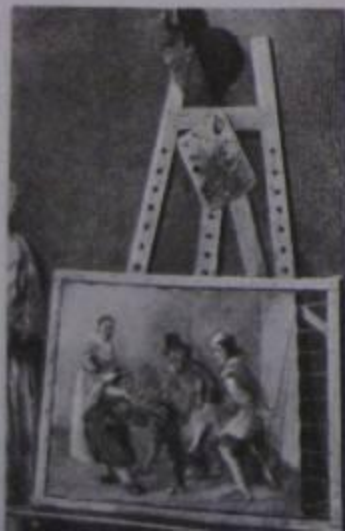
Изображение подрамника и мольберта на картине XVII века.

Это прямоугольник, составленный из тонких