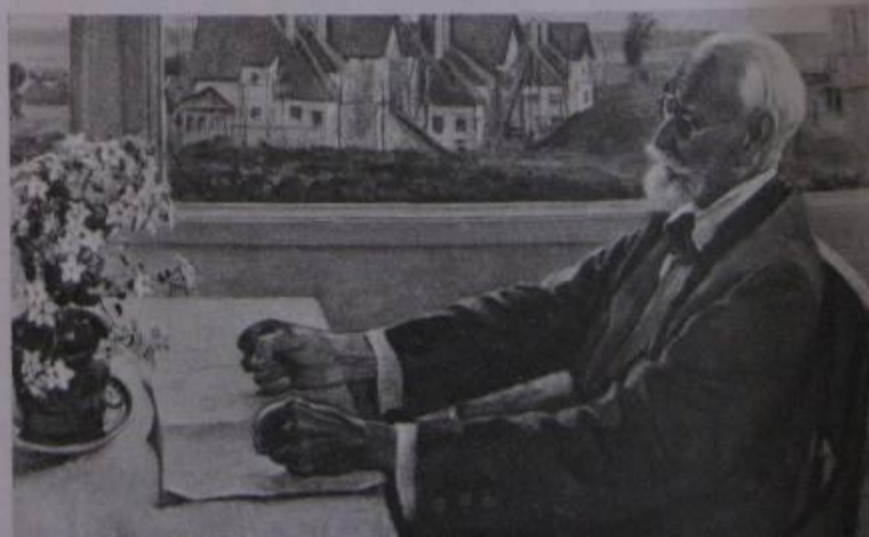
Михаил Нестеров. 1862—1942. Портрет академика

Каждый портретист, создавая образ какого-нибудь человека, стремится передать самые важные черты его характера. Когда советский художник М. Нестеров работал над портретом И. Павлова, он подчеркнул страстность и увлеченность ученого, полного жизни и энергии, несмотря на старость.