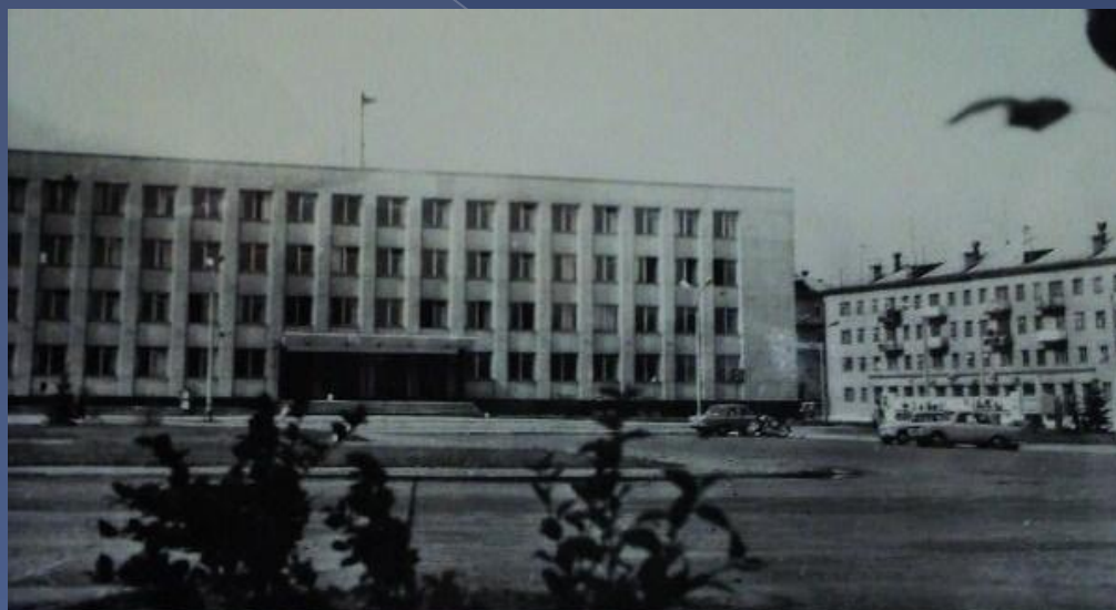
здание городского Совета депутатов трудящихся