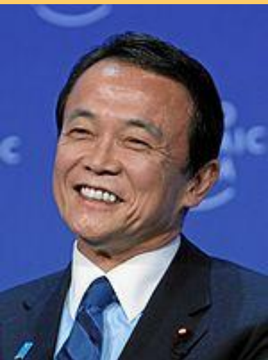
Таро Асо, лидер ЛДП