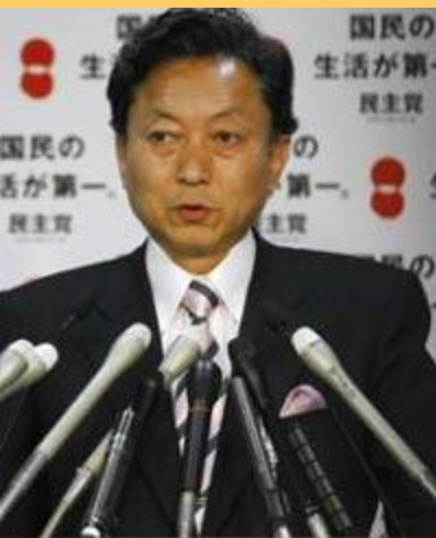
Юкио Хатояма, лидер ДПЯ