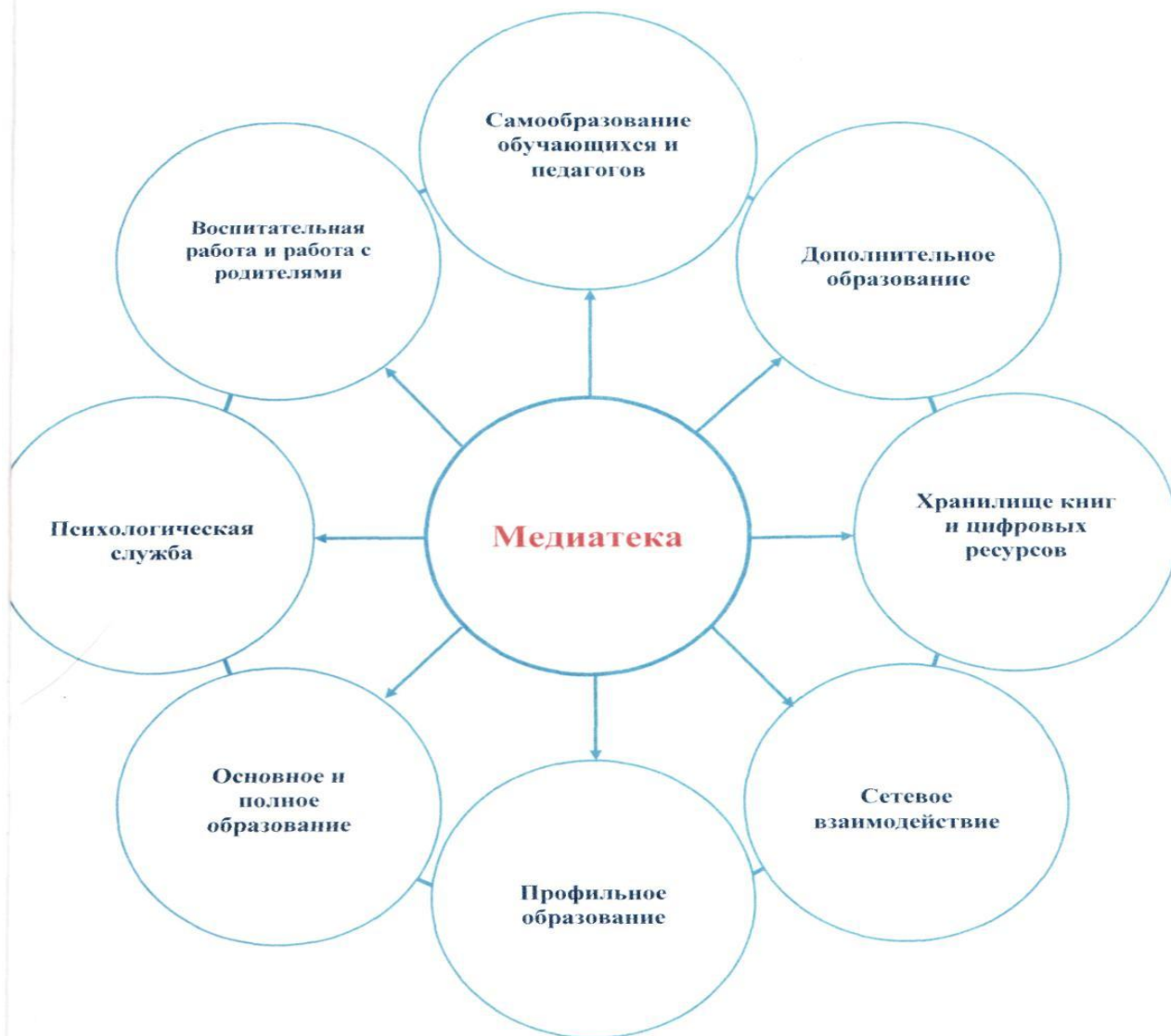
Схема организации единого информационного образовательного пространства школы.