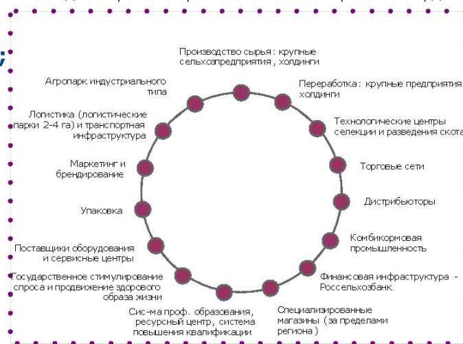
Этапы долгосрочного развития АПК Республики Мордовия